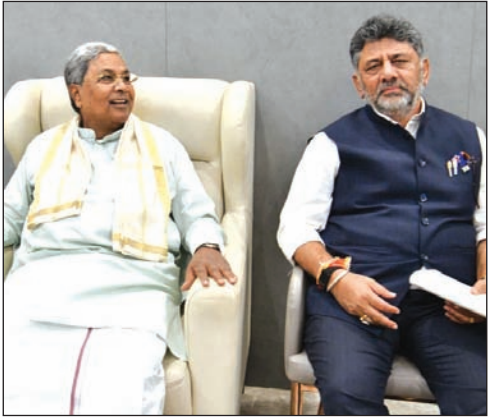
ಸಿ ಎಂ ಡಿ ಕೆ ಶಿವಕುಮಾರ್ ಅವರು ನಿಕಟಪೂರ್ವ ಸಿ ಎಂ ಸಿದ್ದರಾಮಯ್ಯ ಅವರನ್ನು ಕಾವೇರಿ ನಿವಾಸದಲ್ಲಿ ಮಂಗಳವಾರ ಭೇಟಿ ಮಾಡಿ, ಸಮಾಲೋಚನೆ ನಡೆಸಿದರು. ಇದೊಂದು ಸೌಜನ್ಯದ ಭೇಟಿಯಾಗಿತ್ತು.