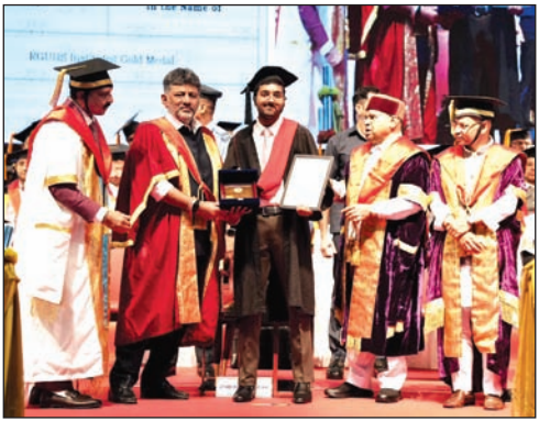
ಸಿ ಎಂ ಡಿ ಕೆ ಶಿವಕುಮಾರ್ ಅವರು ಘಟಿಕೋತ್ಸವದಲ್ಲಿ ವಿದ್ಯಾರ್ಥಿಗಳಿಗೆ ಪದವಿ ಪ್ರದಾನ ಮಾಡಿದರು.