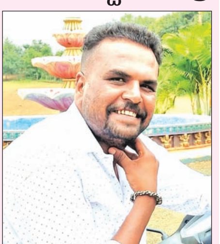
ವಿದ್ಯುತ್ ಶಾಕ್ ತಗುಲಿ ಸಾವನ್ನಪ್ಪಿರಬಹುದು ಎಂದು ಮತ್ತೆ ಕೆಲವರು ಶಂಕಿಸಿದ್ದಾರೆ.