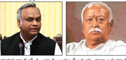
ರಹಸ್ಯವಾಗಿಲ್ಲ, ಹೀಗಾಗಿ ಆ ಸಂಸ್ಥೆಯನ್ನು ಕಡ್ಡಾಯವಾಗಿ ನೋಂದಣಿ ಮಾಡಿಕೊಳ್ಳಬೇಕು ಎಂದು ಗೃಹ ಸಚಿವ ಪ್ರಿಯಾಂಕ್ ಖರ್ಗೆ ಇತ್ತೀಚೆಗೆ ಹೇಳಿದ್ದರು. ಈ ಬಗ್ಗೆ ಕೇರಳದ ತ್ರಿಶೂರ್ನಲ್ಲಿ ಭಾನುವಾರ ನಡೆದ

• ಮಲ್ಲಮ್ಮ ನುಡಿ ವಾರ್ತೆ ತಿಪ್ಪೂರು ಆರ್ಎಸ್ಎಸ್ ಕಡ್ಡಾಯವಾಗಿ ನೋಂದಣಿ ಮಾಡಿಕೊಳ್ಳಬೇಕು ಎಂಬ ಕರ್ನಾಟಕ ಸರ್ಕಾರದ ವಾದಕ್ಕೆ ಸ್ಪಷ್ಟ ಆರ್ಎಸ್ಎಸ್ ಮುಖ್ಯಸ್ಥ ಮೋಹನ್ ಭಾಗವತ್ ಪ್ರತಿಕ್ರಿಯೆ ನೀಡಿದ್ದಾರೆ. "ಇದೊಂದು ಗಿಮ್ಮಿಕ್. ಯಾವುದೂ ರಹಸ್ಯವಾಗಿಲ್ಲ. ಬಯಲಿನಲ್ಲಿ ಕೆಲಸ ಮಾಡುತ್ತೇವೆ ಎಂದ ಭಾಗವತ್ ಹಿಂದೂ ಧರ್ಮ ಎಲ್ಲಾದರೂ ರಿಜಿಸ್ಟರ್ ಆಗಿದೆಯೇ?" ಎಂದು ಪ್ರಶ್ನೆ ಮಾಡಿದ್ದಾರೆ. ರಾಷ್ಟ್ರೀಯ ಸ್ವಯಂಸೇವಕ ಸಂಘದ ಚಟುವಟಿಕೆಗಳು ಕಾರ್ಯಕ್ರಮವೊಂದರಲ್ಲಿ ಸರಸಂಘಾಲಕ ಮೋಹನ್ ಭಾಗವತ್ ಮಾತನಾಡಿದರು. ರಹಸ್ಯವಾಗಿಲ್ಲ. ಬಯಲಿನಲ್ಲಿ ಕೆಲಸ ಮಾಡುತ್ತೇವೆ. "ನಾವು ಯಾವುದೇ ರಹಸ್ಯ ಚಟುವಟಿಕೆಗಳನ್ನು ನಡೆಸುತ್ತಿಲ್ಲ. ನಮ್ಮ ಶಾಖೆಗಳು ಮತ್ತು ಕಾರ್ಯಕ್ರಮಗಳು ತೆರೆದ ಮೈದಾನಗಳಲ್ಲಿ ನಡೆಯುತ್ತವೆ. ಜನರನ್ನು ಕರೆದು ಸಂಘದ ಬಗ್ಗೆ ಅವರಿಗೆ ಮುಕ್ತವಾಗಿ ತಿಳಿಸುತ್ತೇವೆ. ನಮ್ಮ ಕಾರ್ಯಕರ್ತರು ಪ್ರತಿದಿನ ಜನರ ನಡುವೆ ಇರುತ್ತಾರೆ. ಜನರು ನಮ್ಮನ್ನು ದಿನನಿತ್ಯ ನೋಡುತ್ತಾರೆ."