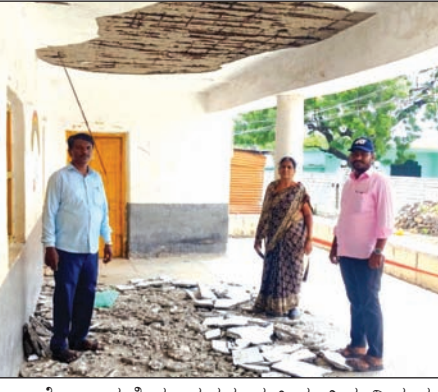
ಮೇಲ್ವಿಚಾರಣೆ ಪದರು ಕುಸಿದು ಬಿದ್ದ ವಿಷಯ ತಿಳಿಯುತ್ತಿದ್ದಂತೆ ಸಿ.ಆರ್.ಪಿ ಮತ್ತು ಸಹ ಶಿಕ್ಷಕರೊಂದಿಗೆ ಶಾಲೆಗೆ ಜಂಟಿಯಾಗಿ ಭೇಟಿ ನೀಡಿ ಪರಿಶೀಲಿಸಿದ ಮುಖ್ಯಗುರುಗಳು, ಸದರಿ ಸ್ಥಳದ ಹತ್ತಿರ ಸಾರ್ವಜನಿಕರು, ಮಕ್ಕಳು ಸೇರಿದಂತೆ ಯಾರೂ ಹೋಗದಂತೆ ತಿಳಿ ಹೇಳಲಾಗಿದೆ ಎಂದಿದ್ದಾರೆ.