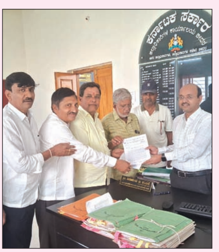
ಮನವಿ ಮಾಡಿರುವ ಪತ್ರವನ್ನು ಜಿಲ್ಲಾಧಿಕಾರಿ ಅವರಿಗೆ ಸಲ್ಲಿಸಲಾಯಿತು.

• ಮಲ್ಲಮ್ಮ ನುಡಿ ವಾರ್ತೆ ಬೀದರ ಪತ್ರಿಕಾ ಭವನದ ನಿರ್ವಹಣಾ ಸಮಿತಿ ಬಗ್ಗೆ ಕರ್ನಾಟಕ ಕಾರ್ಯನಿರತ ದಿನಪತ್ರಿಕೆಗಳ ಸಂಪಾದಕರ ಸಂಘ ಬೀದರ ಜಿಲ್ಲೆ ಘಟಕದ ವತಿಯಿಂದ ಬೀದರ ಜಿಲ್ಲಾಧಿಕಾರಿ ಅವರಿಗೆ ಇಂದು ಅವರ ಕಚೇರಿಯಲ್ಲಿ ಭೇಟಿ ಮಾಡಿ ಚರ್ಚೆ ಮಾಡಲಾಯಿತು ಅದರಲ್ಲಿ ನಮ್ಮ ಸಂಘದ ಪ್ರತಿನಿಧಿಗಳು ಮತ್ತು ಹಿರಿಯ ಸಂಪಾದಕರು ಒಳಗೊಂಡ ಸಮಿತಿ ರಚಿಸಬೇಕೆಂದು ನಮ್ಮ ಸಂಘದ ವತಿಯಿಂದ ಮನವಿ ಪತ್ರ ನೀಡಲಾಯಿತು. ಜಿಲ್ಲೆಯ ಮಾಧ್ಯಮ ಪಟ್ಟಿಯಲ್ಲಿ ಯಲ್ಲಿರುವ ಸಂಪಾದಕರು ಮತ್ತು ಮಾನ್ಯತೆ ಹೊಂದಿದ ಹತ್ತಕರ್ತರನ್ನು ಸೇರಿಸಿ ಸಮಿತಿ ರಚಿಸಬೇಕೆಂದು. ಈ ಸಮಿತಿಯಲ್ಲಿ ನಮ್ಮ ಸಂಘದ ಪ್ರತಿನಿಧಿಗಳು ಹಿರಿಯರು ಮತ್ತು ನಮ್ಮ ಸಂಘದ ಪದಾಧಿಕಾರಿಗಳನ್ನು ಸೇರಿಸಿಕೊಂಡು ಪಟ್ಟಿ ಮಾಡಬೇಕೆಂದು ಸಂಘ