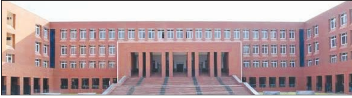
ವಿವಾದವೂ ಉದ್ಭವಿಸಿದೆ. ನಿಯಮಾನುಸಾರ KSET/NET ಅಥವಾ ಸಂಬಂಧಿತ ಅರ್ಹತೆ ಹೊಂದಿರುವ ಅಭ್ಯರ್ಥಿಗಳಿಗೆ ಅರ್ಹತೆ ನೀಡಬೇಕೆಂದರೂ, ವಿಖ್ಯಾತ ಅರ್ಹತೆ ಇಲ್ಲದ ಅಭ್ಯರ್ಥಿಯನ್ನು ಅತಿಥಿ ಉಪನ್ಯಾಸಕರಾಗಿ ಆಯ್ಕೆ ಮಾಡಲಾಗಿದೆ ಎಂಬ ಆರೋಪಗಳು ಕೇಳಿಬಂದಿವೆ.

ಕೊಪ್ಪಳ ವಿಶ್ವವಿದ್ಯಾಲಯದ ವ್ಯಾಪ್ತಿಯಲ್ಲಿರುವ ವಿವಿಧ ಸ್ನಾತಕೋತ್ತರ (ಪಿ.ಜಿ) ಕೇಂದ್ರಗಳಲ್ಲಿ ಉಪನ್ಯಾಸಕರ ನೇಮಕಾತಿ ಪ್ರಕ್ರಿಯೆಯಲ್ಲಿ ವಿವಾದದ ಕೇಂದ್ರಬಿಂದುವಾಗಿದ್ದು, ಆಯ್ಕೆ ಪ್ರಕ್ರಿಯೆಯಲ್ಲಿ ಪಾರದರ್ಶಕತೆ ಕೊರತೆ, ತಾರತಮ್ಯ ಹಾಗೂ ಅರ್ಹತಾ ಮಾನದಂಡಗಳ ಉಲ್ಲಂಘನೆ ನಡೆದಿದೆ ಎಂಬ ಗಂಭೀರ ಆರೋಪಗಳು ಕೇಳಿಬಂದಿವೆ.