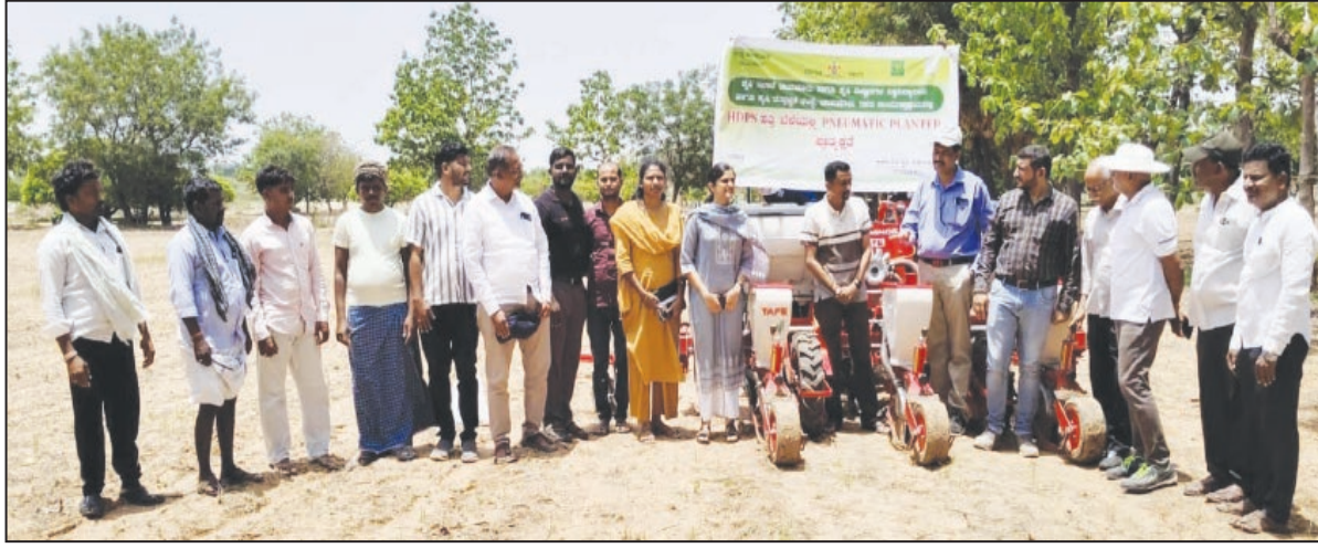
2031ರ ವೇಳೆಗೆ ಹತ್ತಿ ಉತ್ಪಾದಕತೆಯನ್ನು ಪ್ರತಿ ಹೆಕ್ಟೇರ್‌ಗೆ 440 ಕೆ.ಜಿ ಯಿಂದ 755 ಕೆ.ಜಿ.ಗೆ ಹೆಚ್ಚಿಸುವುದು. ಹೆಚ್ಚಿನ ಇಳುವರಿ ನೀಡುವ, ಹವಾಮಾನ ವೈಪರೀತ್ಯ ಮತ್ತು ಕೀಟಗಳನ್ನು ತಡೆದುಕೊಳ್ಳಲು ಬಲ್ಲ ಬೀಜಗಳ ಅಭಿವೃದ್ಧಿ, ದಾರುಗಳು ಉದ್ದವಾಗಿರುವ ಮತ್ತು

ಕೇಂದ್ರ ಸರ್ಕಾರವು 5,659 ಕೋಟಿ ರೂ. ವೆಚ್ಚದಲ್ಲಿ ಹತ್ತಿ ಉತ್ಪಾದಕತೆ ಮಿಷನ್ ಯೋಜನೆಯನ್ನು ಜಾರಿಗೊಳಿಸಿದೆ. ಯೋಜನೆಯು 2026ರಿಂದ 31ರವರೆಗೆ ಮಹತ್ವಾಕಾಂಕ್ಷಿಯ ಯೋಜನೆಯು ಹತ್ತಿ ಇಳುವರಿ ಹೆಚ್ಚಿಸಲು ಮತ್ತು ರೈತರ ಆದಾಯವನ್ನು ವೃದ್ಧಿಸಲು ವೈಜ್ಞಾನಿಕ ಹಾಗೂ ತಾಂತ್ರಿಕ ಬೆಂಬಲವನ್ನು ಒದಗಿಸುತ್ತದೆ ಎಂದು.