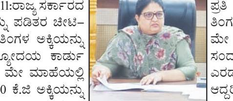
ಪತ್ರಿ ಸದಸ್ಯರಿಗೆ 5 ಕೆ.ಜಿ ಯಂತೆ ಮೇ ಮತ್ತು ಜೂನ್ ಎರಡು ತಿಂಗಳಿಗೆ ಒಟ್ಟು 10 ಕೆ.ಜಿ ಅಕ್ಕಿ ವಿತರಣೆ ಮಾಡಲಾಗುವುದು. ಮೇ ಹಾಗೂ ಜೂನ್ ತಿಂಗಳ ಪಡಿತರವನ್ನು ಒಟ್ಟಿಗೆ ಪಡೆಯುವ ಸಂದರ್ಭದಲ್ಲಿ, ಕಾರ್ಡ್ ದಾರರು ತಾಂತ್ರಿಕ ದಾಖಲೆಗಳಿಗಾಗಿ ಎರಡು ಬಾರಿ ಹೆಚ್ಚಿನ ಗುರುತು ನೀಡುವುದು ಕಡ್ಡಾಯವಾಗಿದೆ. ಆದ್ದರಿಂದ ಪಡಿತರ ಚೀಟಿದಾರರು ಯಾವುದೇ ಗೊಂದಲಕ್ಕೆ ಒಳಗಾಗದೆ ಸಹಕರಿಸಬೇಕು. ಎರಡು ಬಾರಿ ಬೆರಳು ಮುದ್ರೆ ನೀಡಿದ ನಂತರವಷ್ಟೇ ಪೂರ್ಣ ಪ್ರಮಾಣದ ಧಾನ್ಯ ಲಭ್ಯವಾಗಲಿದೆ. ಪಡಿತರದಾರರು ಮೇ ಮತ್ತು ಜೂನ್ ಎರಡು ತಿಂಗಳ ಅಕ್ಕಿಯನ್ನು ಪಡೆದುಕೊಳ್ಳಬಹುದು ಎಂದು ಜಿಲ್ಲಾಧಿಕಾರಿ ಕವಿತಾ ಎಸ್ ಮನ್ಸಿಕೇರಿ ತಿಳಿಸಿದ್ದಾರೆ.

ಮಲ್ಲಮ್ಮ ನುಡಿ ವಾರ್ತೆ ವಿಜಯನಗರ(ಹೊಸಪೇಟೆ)ಜೂ.11:ರಾಜ್ಯ ಸರ್ಕಾರದ ಮಹತ್ವಾಕಾಂಕ್ಷಿ ಯೋಜನೆಯಡಿ ಅನ್ನಭಾಗ್ಯ ಅಕ್ಕಿಯನ್ನು ಪಡಿತರ ಚೀಟಿ-ದಾರರಿಗೆ ಮೇ ಹಾಗೂ ಜೂನ್ ಮಾಹೆಯ ಎರಡು ತಿಂಗಳ ಅಕ್ಕಿಯನ್ನು ಒಂದೇ ಬಾರಿಗೆ ಹಂಚಿಕೆ ಮಾಡಲಾಗುವುದು. ಅಂತೋದೆಯ ಕಾರ್ಡ್ ಹೊಂದಿದ 4 ಸದಸ್ಯರಿರುವ ಪಡಿತರ ಪಡಿತರ ಚೀಟಿಗೆ ಮೇ ಮಾಹೆಯಲ್ಲಿ 5 ಕೆಜಿ ಮತ್ತು ಜೂನ್ ತಿಂಗಳಲ್ಲಿ 5 ಕೆಜಿ ಸೇರಿ ಒಟ್ಟು 10 ಕೆಜಿ ಅಕ್ಕಿಯನ್ನು ವಿತರಿಸಲಾಗುವುದು. 5 ಸದಸ್ಯರಿರುವ ಅಂತೋದೆಯ ಪಡಿತರದಾರರಿಗೆ 30 ಕೆ.ಜಿ.6 ಸದಸ್ಯರಿರುವ ಚೀಟಿಗೆ 50 ಕೆ.ಜಿ, 7 ಸದಸ್ಯರಿದ್ದಲ್ಲಿ 70 ಕೆ.ಜಿ.8 ಸದಸ್ಯರಿರುವ ಪಡಿತರದಾರರಿಗೆ 90 ಕೆ.ಜಿ, 9 ಸದಸ್ಯರಿರುವ ಚೀಟಿಗೆ 110 ಕೆ.ಜಿ ಹಾಗೂ 10 ಸದಸ್ಯರಿರುವ ಚೀಟಿಗೆ ಒಟ್ಟು 130 ಕೆ.ಜಿ ಹಾಗೂ ಬಿ.ಪಿ.ಎಲ್ ಕಾರ್ಡ್ ಹೊಂದಿದ