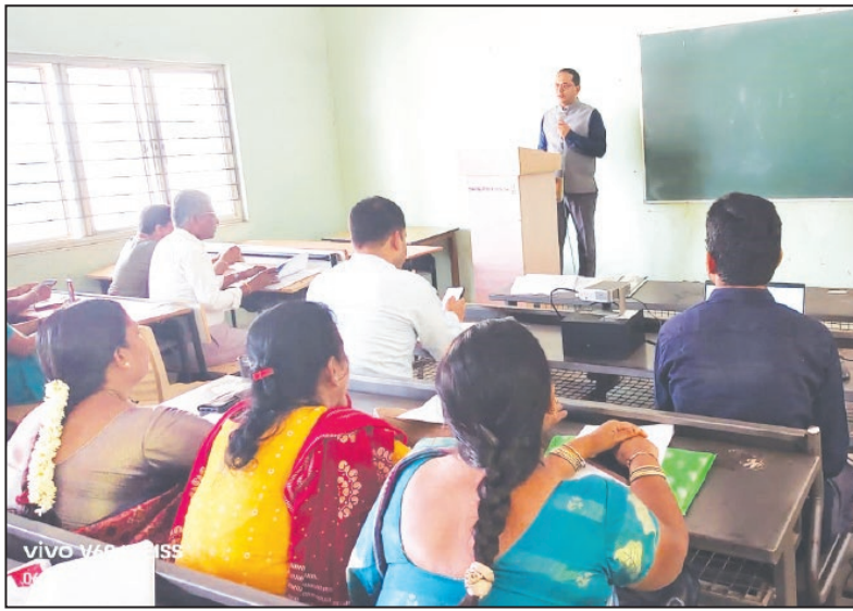
ಬಿ.ಎಲ್.ಓ.ಗಳು ಪ್ರತಿಯೊಂದು ಮನೆಗೆ ಖುದ್ದಾಗಿ ಭೇಟಿ ನೀಡಿ ಮಾಹಿತಿ ಪರಿಶೀಲಿಸಬೇಕು.

ಅರ್ಹ ಮತದಾರರು ಚುನಾವಣಾ ಪ್ರಕ್ರಿಯೆಯಿಂದ ವಂಚಿತರಾಗಬಾರದು ಮತ್ತು ಮುಂಬರುವ ಚುನಾವಣೆಗಳನ್ನು ದೋಷಮುಕ್ತ ಮತದಾರರ ಪಟ್ಟಿಯೊಂದಿಗೆ ಎದುರಿಸಬೇಕು ಎಂಬ ಉದ್ದೇಶದಿಂದ ಈ ತರಬೇತಿ ಹಾಗೂ ಕಾರ್ಯಾಗಾರ ಆಯೋಜಿಸಲಾಗುತ್ತಿದೆ ಎಂದರು.