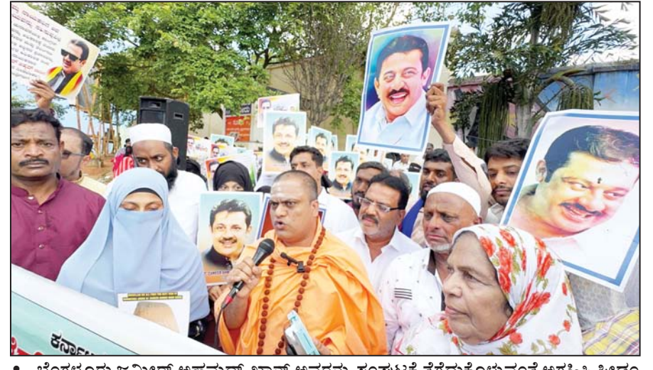
ಬೆಂಗಳೂರು ಜಮೀನ್ ಅಹಮದ್ ಖಾನ್ ಅವರನ್ನು ಸಂಪುಟಕ್ಕೆ ತೆಗೆದುಕೊಳ್ಳುವಂತೆ ಅಗ್ರಹಿಸಿ ಪೀಡಂ ಪಾರ್ಕ್ ನಲ್ಲಿ ಮುಖಂಡರು ಅಭಿಮಾನಿಗಳು ಬೃಹತ್ ಪ್ರತಿಭಟನೆ ನಡೆಸಿದರು..