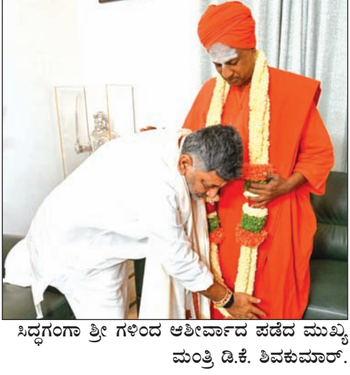
ಸಿದ್ದಗಂಗಾ ಶ್ರೀ ಗಳಿಂದ ಆಶೀರ್ವಾದ ಪಡೆದ ಮುಖ್ಯ ಮಂತ್ರಿ ಡಿ.ಕೆ. ಶಿವಕುಮಾರ್.