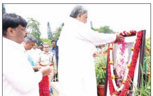
ಮುಖ್ಯಮಂತ್ರಿ ಸಿದ್ದರಾಮಯ್ಯನವರು ಇಂದು ವಿಧಾನಸೌಧದ ಪೂರ್ವ ದಿಕ್ಕಿನಲ್ಲಿರುವ ಮಾಜಿ ಪ್ರಧಾನಮಂತ್ರಿ ಜವಾಹರಲಾಲ್ ನೆಹರು ರವರ ಪುಣ್ಯ ಸ್ಮರಣೆ ಅಂಗವಾಗಿ ಅವರ ಪ್ರತಿಮೆ ಬಳಿ ಅವರ ಭಾವಚಿತ್ರಕ್ಕೆ ಪುಷ್ಪಚರ್ಚೆ ಮಾಡಿ ನಂತರ ಮಾಧ್ಯಮ ದವರೊಂದಿಗೆ ಮಾತನಾಡಿದರು.