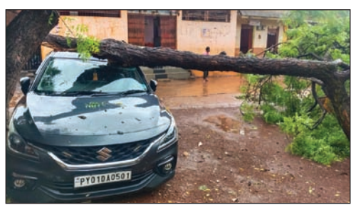
ಹುಮನಾಬಾದ: ಬೆಳಿಗ್ಗೆ ಧಾರಕಾರ ಮಳೆ ಬಿದ್ದ ಒನ್ನಲೆಯಲ್ಲಿ ರಸ್ತೆಯ ಮೇಲೆ ನೀರು ನಿಂತುಕೊಂಡಿವೆ. ಹಾಗೂ ಮೊಳಕೇರಾ ಗ್ರಾಮದ ಮೋಳಿಗಿ ಮರಾಯ ದೇವಸ್ಥಾನದ ಹತ್ತಿರ ಯಾರೋ ಒಬ್ಬ ವ್ಯಕ್ತಿ ಗಿಡದ ಕೆಳಗೆ ಕಾರು ನಿಲ್ಲಿಸಿ ಹೋಗಿದ್ದರು. ಧಾರಕಾರ ಮಳೆಯೊಂದಿಗೆ ಗಾಳಿ ತೂರಿ ಮರಗಳು, ಕೊಂಬೆಗಳು ಬಿದ್ದು ಕಾರು ಜಖಂಮಗೊಂಡಿರುವ ದೃಶ್ಯ ಕಾಣಬಹುದು.