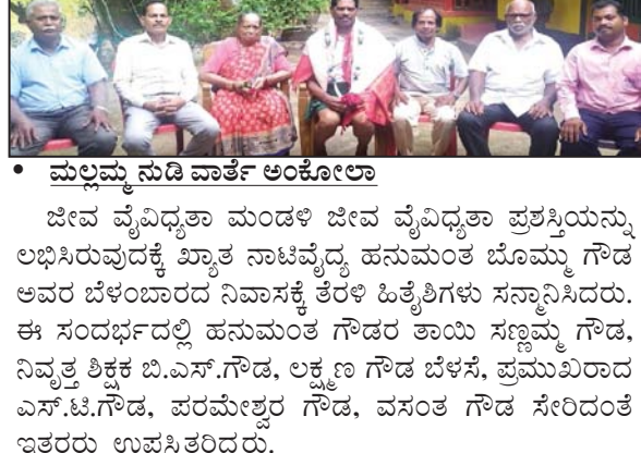
ಮಲ್ಲಮ್ಮ ನುಡಿ ವಾರ್ತೆ ಅಂಕೋಲಾ