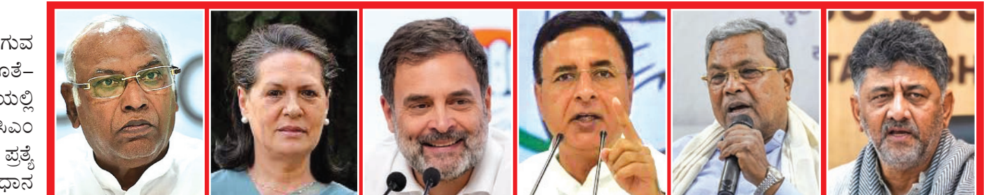
ನಾಯಕತ್ವ ಗೊಂದಲ ಪರಿಹಾರಕ್ಕೆ ಸೂತ್ರ

• ಮಲ್ಲಮ್ಮ ನುಡಿ ವಾರ್ತೆ ಬೆಂಗಳೂರು ಕರ್ನಾಟಕ ಕಾಂಗ್ರೆಸ್‌ನಲ್ಲಿ ಎಲ್ಲವೂ ಸುಖ್ಯಾಂತ್ಯವಾಗುವ ಲಕ್ಷಣಗಳು ಕಾಣಿಸಿಕೊಂಡಿವೆ. ಕುರ್ಚಿಯ ಕಡನ ಜೊತೆಗೆ ಸಂಪುಟ ಪುನಾರಚನೆ ವಿಷಯವೂ ದಿಲ್ಲಯಲ್ಲಿ ಗಮನ ಸೆಳೆದಿದ್ದು, ಕ್ಲೈಮ್ಯಾಕ್ಸ್ ಹಂತ ತಲುಪಿದೆ. ಸಿಎಂ ಸಿದ್ದರಾಮಯ್ಯ-ಹೈಕಮಾಂಡ್ ನಾಯಕರ ಜೊತೆ ಪ್ರತ್ಯೇಕ ಸಭೆ ನಡೆದಿದೆ. ಹೆಚ್‌ಲಿಯ ಎಐಸಿಸಿ ಪ್ರಧಾನ ಕಚೇರಿಯಲ್ಲಿ ಈ ಕ್ಲೋಸ್ ಡೋರ್ ಸಭೆ ನಡೆದಿದ್ದು, ಮಹತ್ವದ ಬೆಳವಣಿಗೆಯ ಸಾಧ್ಯತೆ ಇದೆ. ಗಣನಾಯಕರು ಭಾಗಿ: ಎಐಸಿಸಿ ಅಧ್ಯಕ್ಷ ಮಲ್ಲಿಕಾರ್ಜುನ ಖರ್ಗೆ, ಲೋಕಸಭೆ ಪ್ರತಿಪಕ್ಷದ ನಾಯಕ ರಾಮ್ ಗಾಂಧಿ, ಎಐಸಿಸಿ ಪ್ರಧಾನ ಕಾರ್ಯದರ್ಶಿ ಕೆ.ವೆ.ನಿರೋಷ್, ರಾಜ್ಯ ಕಾಂಗ್ರೆಸ್ ಉಸ್ತುವಾರಿ ರಣದೀಪ್ ಸಿಂಗ್ ಸುಜೇವ್‌ವಾಲ ಅವರು ಸಭೆಯಲ್ಲಿ ಭಾಗಿಯಾಗಿದ್ದರು. ಸಿಎಂ ಅಭಿಪ್ರಾಯ ಮಂಡನೆ?: ಅಂತರಿಕ ಮಾತುಕತೆಯ ಮಾಹಿತಿಗಳು ಹೊರ ಬಂದಿಲ್ಲ. ಆದರೆ, ಸುದೀರ್ಘ ಅವಧಿಯ ಮಾತುಕತೆಯಲ್ಲಿ ಕೆಲವೊಂದು ಮಹತ್ವದ ಚರ್ಚೆಗಳು ನಡೆದಿರುವ ಸಾಧ್ಯತೆ ಇದೆ. ನಾಯಕತ್ವ ಬದಲಾವಣೆ ವಿಚಾರವಾಗಿ ಸಿಎಂ ಸಿದ್ದರಾಮಯ್ಯ ಅವರು ತಮ್ಮ ಅಭಿಪ್ರಾಯ ಮಂಡಿಸಿರುವ ಸಾಧ್ಯತೆ ಇದೆ.