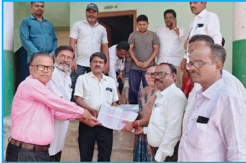
ಜಗದಲಿ ಎಲ್ಲಕ್ಕಿಂತಲೂ ಅಮೂಲ್ಯಕೊನೆಯ ಮಗುವಿನ ಕೈಗೂ ತಲುಪಲಿ ಈ ಅಕ್ಷರದ