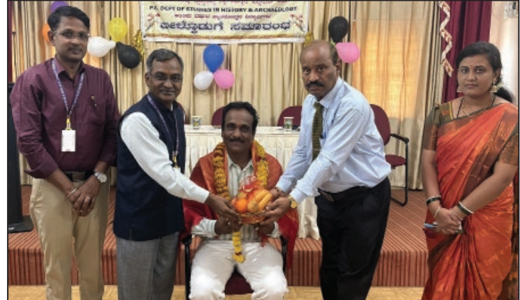
ಅವಕಾಶಗಳಿವೆ. ಅವುಗಳನ್ನು ಸರಿಯಾದ ಸಮಯದಲ್ಲಿ ಬಳಸಿಕೊಳ್ಳಬೇಕು. ತಮ್ಮತನವನ್ನು ಗಟ್ಟಿಗೊಳಿಸಿ ತಮ್ಮಲ್ಲಿನ ಶಕ್ತಿಯನ್ನು ಬಿಟ್ಟುಕೊಡದೇ ಪರಿಶ್ರಮದಿಂದ ಗುರಿಯನ್ನು ಮುಟ್ಟಬೇಕು ಎಂದರಲ್ಲದೆ, ಸಮಾಜದಲ್ಲಿ ಆತ್ಮವಿಶ್ವಾಸದಿಂದ ಬದುಕಲು ನಾಯಕತ್ವಗುಣಗಳನ್ನು ಬೆಳೆಸಿಕೊಳ್ಳುವುದು ಅಗತ್ಯ ಎಂದು ಸಲಹೆ ನೀಡಿದರು.