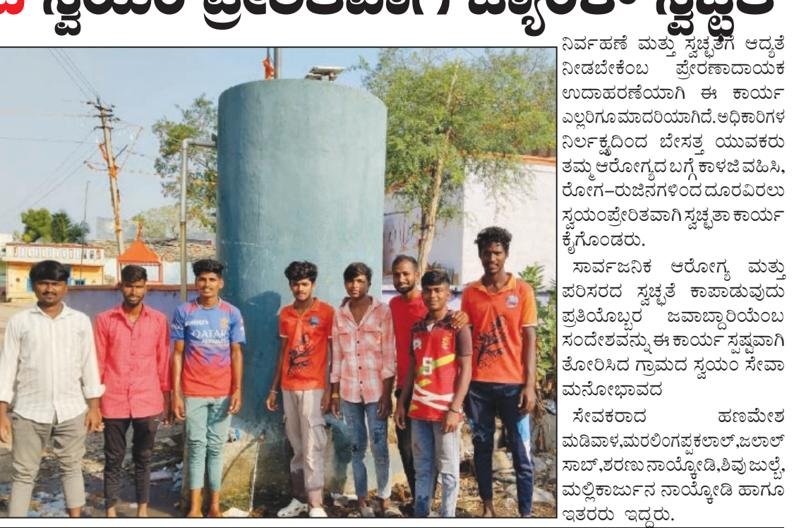
ನಿರ್ವಹಣೆ ಮತ್ತು ಸ್ವಚ್ಛತೆಗೆ ಆದ್ಯತೆ ನೀಡಬೇಕೆಂಬ ಪ್ರೇರಣಾದಾಯಕ ಉದಾಹರಣೆಯಾಗಿ ಈ ಕಾರ್ಯ ಎಲ್ಲರಿಗೂ ಮಾದರಿಯಾಗಿದೆ.

ಮಲ್ಲಮ್ಮ ನುಡಿ ವಾರ್ತೆ ಯಾದಗಿರಿ ಜಿಲ್ಲೆಯ ಗುರುಮಠಕಲ್ ತಾಲೂಕಿನ ಯಂಪಾಡ ಗ್ರಾಮದ ಹನುಮಾನ ದೇವಸ್ಥಾನದ ಸಮೀಪದಲ್ಲಿರುವ ಕುಡಿಯುವ ನೀರಿನ ಟ್ಯಾಂಕ್ ಕಲ್ಮು-ಮಣ್ಣುಗಳಿಂದ ಅಶುಚಿಯಾಗಿರುವುದನ್ನು ಮತ್ತು ಅಧಿಕಾರಿಗಳ ನಿರ್ಲಕ್ಷ್ಯದಿಂದ ಬೇಸತ್ತ ಯುವಕರು ತಮ್ಮ ಆರೋಗ್ಯದ ಬಗ್ಗೆ ಕಾಳಜಿ ವಹಿಸಿ, ರೋಗ-ರುಜಿನಗಳಿಂದ ದೂರವಿರಲು ಸ್ವಯಂ ಪ್ರೇರಿತವಾಗಿ ಸ್ವಚ್ಛತಾ ಕಾರ್ಯ ಕೈಗೊಂಡರು.