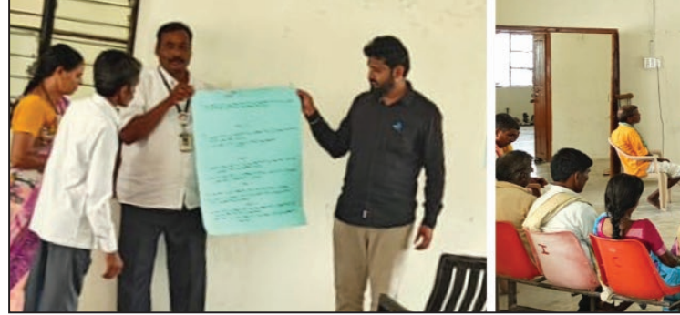
ಅವಕಾಶಗಳಿವೆ. ಅವುಗಳನ್ನು ಸರಿಯಾದ ಸಮಯದಲ್ಲಿ ಬಳಸಿಕೊಳ್ಳಬೇಕು. ತಮ್ಮತನವನ್ನು ಗಟ್ಟಿಗೊಳಿಸಿ ತಮ್ಮಲ್ಲಿನ ಶಕ್ತಿಯನ್ನು ಬಿಟ್ಟುಕೊಡದೇ ಪರಿಶ್ರಮದಿಂದ ಗುರಿಯನ್ನು ಮುಟ್ಟಬೇಕು ಎಂದರಲ್ಲದೆ, ಸಮಾಜದಲ್ಲಿ ಆತ್ಮವಿಶ್ವಾಸದಿಂದ ಬದುಕಲು ನಾಯಕತ್ವಗುಣಗಳನ್ನು ಬೆಳೆಸಿಕೊಳ್ಳುವುದು ಅಗತ್ಯ ಎಂದು ಸಲಹೆ ನೀಡಿದರು.

ಎಪಿಡಿ ಸಂಸ್ಥೆಯ ವತಿಯಿಂದ ವಿಕಲಚೇತನ ಸ್ವ ಸಹಾಯ ಸಂಘದ ಸದಸ್ಯರು ಹಾಗೂ ಆರ್.ಪಿ.ಡಿ ಟಾಸ್ಕ್ ಫೋರ್ಸ್ ಸದಸ್ಯರಿಗಾಗಿ ಅಂಗವಿಕಲ ಹಕ್ಕುಗಳ ಕಾಯ್ದೆ-2016 ಅರಿವು ಮತ್ತು ನಾಯಕತ್ವ ಗುಣಗಳ ಕುರಿತು ಸಾಮರ್ಥ್ಯವೃದ್ಧಿ ಕಾರ್ಯಕ್ರಮವನ್ನು ಗುರುಮಠಕಲ್ ಸಮುದಾಯ ಆರೋಗ್ಯ ಕೇಂದ್ರದಲ್ಲಿ ಸೋಮವಾರ ಆಯೋಜಿಸಲಾಯಿತು.