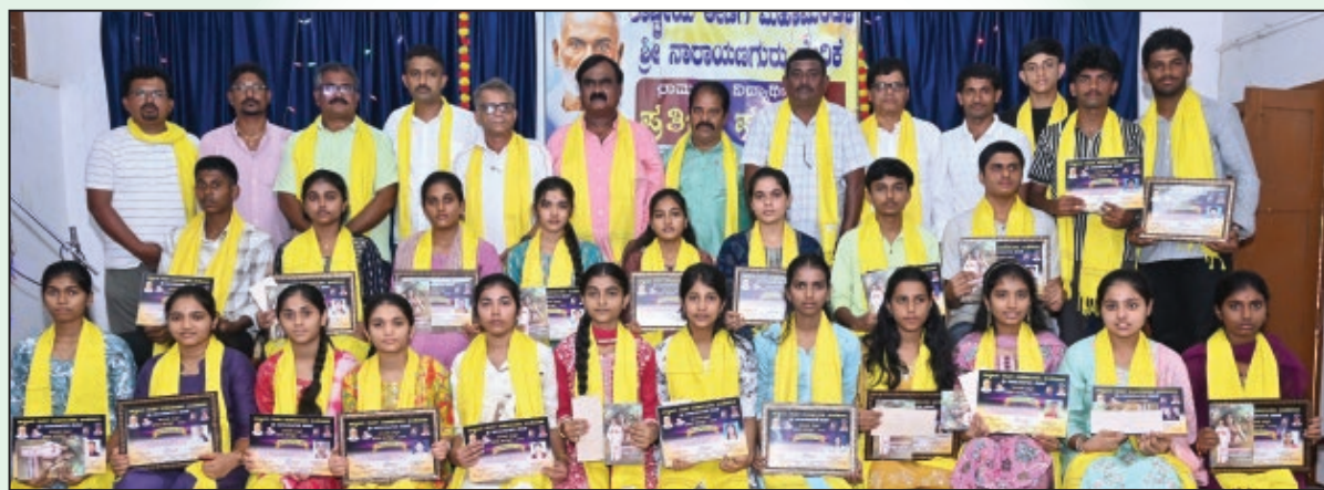
ಮಾತನಾಡಿ, ಪ್ರತಿಭಾ ಪುರಸ್ಕಾರ ಎನ್ನುವುದು ಮಕ್ಕಳಿಗೆ ಉತ್ತೇಜನ ನೀಡುವಂತದ್ದು. ಹೀಗಾಗಿ ಪ್ರತಿವರ್ಷ ಸರಿಯಾದ ಸಮಯಕ್ಕೆ ನಾವು ಕಾರ್ಯಕ್ರಮವನ್ನು ಹಮ್ಮಿಕೊಳ್ಳುತ್ತೇವೆ. ಮಕ್ಕಳು ಕೂಡ ಉತ್ತಮ ಶಿಕ್ಷಣವನ್ನು ಉಚ್ಚ ಭವಿಷ್ಯ ರೂಪಿಸಿಕೊಳ್ಳಲಿ ಎಂದು.