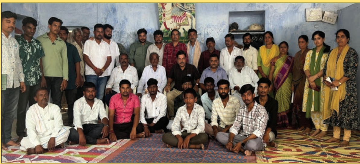
ಸಾಧಕರು ಹಾಗೂ ಪ್ರತಿಭಾವಂತ ವಿದ್ಯಾರ್ಥಿಗಳನ್ನು ಸನ್ಮಾನಿಸುವುದು, ದೇಶಭಕ್ತಿಗೀತೆಗಳು ಹಾಗೂ ವಿಚಾರಗೋಷ್ಠಿಗಳನ್ನು ಆಯೋಜಿಸುವ ರಜಪೂತ ಸಂಸ್ಥೆ ತಿನ್ನುಪ್ರತಿಬಿಂಬಿಸುವ ಸಾಂಸ್ಕೃತಿಕ ಕಾರ್ಯಕ್ರಮಗಳು, ಕುರಿತು ಚರ್ಚಿಸಲಾಯಿತು.