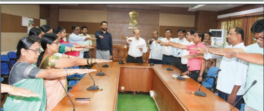
ಕೊಪ್ಪಳ : ಭಯೋತ್ಪಾದನಾ ವಿರೋಧಿ ದಿನದ ಅಂಗವಾಗಿ ಕೊಪ್ಪಳ ಜಿಲ್ಲಾಡಳಿತದ ವತಿಯಿಂದ ಪ್ರಮಾಣ ವಚನ ಸ್ವೀಕರಣ ಕಾರ್ಯಕ್ರಮವು ಗುರುವಾರ ಜಿಲ್ಲಾಧಿಕಾರಿಗಳ ಕಚೇರಿಯ ಸಭಾಂಗಣದಲ್ಲಿ ನಡೆಯಿತು.