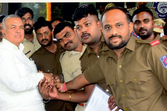
ಮಾನ್ಯ ಸಾರಿಗೆ ಹಾಗೂ ಮುಜರಾಯಿ ಸಚಿವರಾದ ಶ್ರೀ ರಾಮಲಿಂಗಾ ರೆಡ್ಡಿ ಅವರು ನೂತನವಾಗಿ ನೇಮಕಗೊಂಡ ಜಾಲನಾ ಸಿಬ್ಬಂದಿಗಳಿಗೆ ನೇಮಕಾತಿ ಆದೇಶ ನೀಡಿದರು

ಸಂಸ್ಥೆಗಳಲ್ಲಿ ಪರಿಣಾಮಕಾರಿ ತರಬೇತಿ ಕಾರ್ಯಯೋಜನೆ ರೂಪಿಸಿದ್ದು, ಒಂದು ವರ್ಷದ ಅವಧಿಯಲ್ಲಿ 33482 ಸಿಬ್ಬಂದಿಗಳಿಗೆ ತರಬೇತಿ ನೀಡಲಾಗಿದೆ