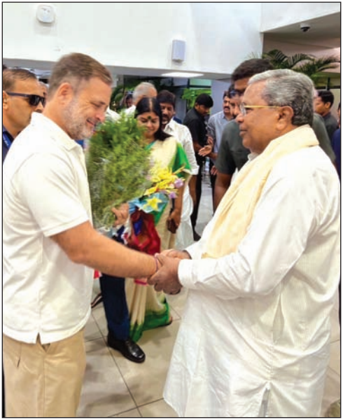
ಕೇರಳನ ತಿರುವನಂತಪುರ ವಿಮಾನ ನಿಲ್ದಾಣದಲ್ಲಿ ಮುಖ್ಯಮಂತ್ರಿ ಸಿದ್ದರಾಮಯ್ಯ ಅವರು ಲೋಕಸಭೆಯ ವಿಪಕ್ಷ ನಾಯಕ, ಕಾಂಗ್ರೆಸ್ ಪಕ್ಷದ ಪಂಚರಾಜ ರಾಹುಲ್ ಗಾಂಧಿ ಅವರನ್ನು ಭೇಟಿಯಾಗಿ ಕುಶಲೋಪಹಾರಿ ವಿಚಾರಿಸಿದ ಸಂದರ್ಭ.