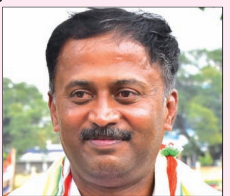
ರೂ.ಗಳನ್ನು ಯಾವುದೇ ಭ್ರಷ್ಟಾಚಾರ, ಕಮಿಷನ್ ಇಲ್ಲದೇ ಡಿಬಿಟಿ ಮೂಲಕ ನೇರವಾಗಿ ಫಲಾನುಭವಿಗಳಿಗೆ ತಲುಪಿಸುತ್ತಿದೆ. ರಾಜ್ಯ ಗೃಹಲಕ್ಷ್ಮಿಯ ಪರವಾಗಿ ಸರ್ಕಾರಕ್ಕೆ ಧನ್ಯವಾದಗಳನ್ನು ತಿಳಿಸುತ್ತೇನೆ ಎಂದು ಪತ್ರಿಕಾ ಹೇಳಿಕೆಯಲ್ಲಿ ತಿಳಿಸಿದ್ದಾರೆ.

ಮಲ್ಲಮ್ಮ ನುಡಿ ವಾರ್ತೆ ಬೆಂಗಳೂರು ರಾಜ್ಯ ಸರ್ಕಾರದ ಮಹತ್ವಾಕಾಂಕ್ಷೆಯ ಯೋಜನೆಗಳಲ್ಲೊಂದಾದ "ಗೃಹಲಕ್ಷ್ಮಿ" ಯೋಜನೆಯು 30ನೇ ಕಂತಿನ ಹಣವನ್ನು ಬಿಡುಗಡೆ ಮಾಡಲಾಗಿದೆ. ಈ ಮೂಲಕ ರಾಜ್ಯದ 1,24,10,668 ಮಹಿಳೆಯರಿಗೆ ತಲಾ 60,000 ರೂ. ಹಣವನ್ನು ನೇರವಾಗಿ ಬ್ಯಾಂಕ್ ಖಾತೆಗೆ ಹಾಕುವ ಮೂಲಕ ಮುಖ್ಯಮಂತ್ರಿ ಸಿದ್ದರಾಮಯ್ಯ ಹಾಗೂ ಉಪಮುಖ್ಯಮಂತ್ರಿ ಡಿ.ಕೆ.ಶಿವಕುಮಾರ್ ನೇತೃತ್ವದ ಕಾಂಗ್ರೆಸ್ ಸರ್ಕಾರ ನುಡಿದಂತೆ ನಡೆಯುತ್ತಿದೆ ಎಂದು ರಾಜ್ಯ ಗ್ಯಾರಂಟಿ ಯೋಜನೆಗಳ ಅನುಷ್ಠಾನ ಪ್ರಾಧಿಕಾರದ ಉಪಾಧ್ಯಕ್ಷ ದಿನೇಶ್ ಗೂಳಿಗೌಡ ಅವರು ತಿಳಿಸಿದ್ದಾರೆ. ಚುನಾವಣೆ ಪೂರ್ವದಲ್ಲಿ ನೀಡಿದ್ದ ಭರವಸೆಯಂತೆ ಮನೆಯ ಯಜಮಾನಿಯರಿಗೆ ಪ್ರತಿ ತಿಂಗಳು 2000 ರೂ.ಗಳಂತೆ ಕಳೆದ ಮೂರು ವರ್ಷದಲ್ಲಿ 60,000