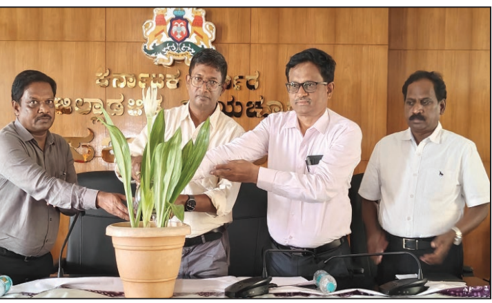
ಅವರು ಮಾತನಾಡಿದರು. ಅಭಿಯಾನದಲ್ಲಿ ಆರ್.ಎ. ಕಾರ್ಡ್, ರೇಷನ್ ಕಾರ್ಡ್, ಆಯುಷ್ಮಾನ್ ಭಾರತ ಕಾರ್ಡ್, ಜಾತಿ ಪ್ರಮಾಣ ಪತ್ರ, ಪಿಎಂ ಕಿಸಾನ್ ಕ್ರೆಡಿಟ್ ಕಾರ್ಡ್, ಜನಧನ್ ಬ್ಯಾಂಕ್ ಖಾತೆ, ಸಾಮಾಜಿಕ ಭದ್ರತಾ ಯೋಜನೆಗಳಾದ ವೃದ್ಧಾಪ್ಯ