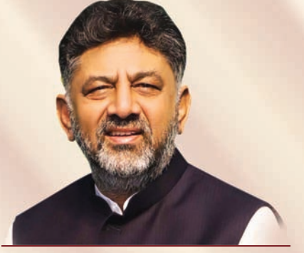
ಶ್ರೀ ಡಿ.ಕೆ. ಶಿವಕುಮಾರ್ ಮಾನ್ಯ ಉಪ ಮುಖ್ಯಮಂತ್ರಿಗಳು ಕರ್ನಾಟಕ ಸರ್ಕಾರ