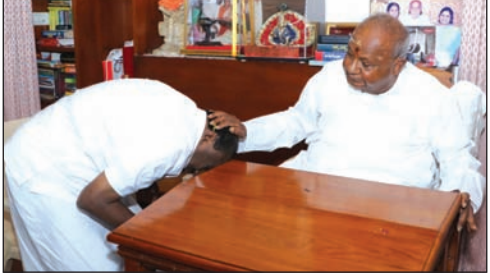
ಮಾನ್ಯ ಕೇಂದ್ರ ಸಚಿವರಾದ ಶ್ರೀ ಹೆಚ್.ಡಿ. ಕುಮಾರಸ್ವಾಮಿ ಅವರು ಇಂದು ಸಂಜೆ ಮಾಜಿ ಪ್ರಧಾನಿಗಳಾದ ಶ್ರೀ ಹೆಚ್.ಡಿ. ದೇವೇಗೌಡ ಅವರನ್ನು ಭೇಟಿಯಾಗಿ ಜನ್ಮದಿನದ ಶುಭಾಶಯಗಳನ್ನು ಕೋರಿ ಆಶೀರ್ವಾದ ಪಡೆದರು.