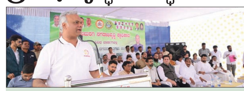
ಪ್ರತಿಯಾಗಿ ರಾಜ್ಯಕ್ಕೆ ಸಿಗುತ್ತಿರುವುದು ಶೂನ್ಯ ಅಭಿವೃದ್ಧಿ ಕಾರ್ಯಗಳ ನಡುವೆಯೂ ಕೇಂದ್ರ ಸರ್ಕಾರದ ಕಡೆ ರಾಜ್ಯದಿಂದ ಮಾರ್ಪಡೆ ರೂ. 6.50 ಲಕ್ಷ ಕೋಟಿ ತೆರಿಗೆ ಹಣ ಕೇಂದ್ರಕ್ಕೆ ಹೋಗುತ್ತಿದ್ದರೂ, ಪ್ರತಿಯಾಗಿ ರಾಜ್ಯಕ್ಕೆ ಸಿಗುತ್ತಿರುವುದು ಶೂನ್ಯ ಎಂದರು. ಜೆ.ಎ.ಜಿ.ಎಸ್ ಮಿಷನ್ ಯೋಜನೆಗೆ ಬರಬೇಕೆಂದು ರೂ. 15,000 ಕೋಟಿ ಅನುದಾನವನ್ನು ಕೇಂದ್ರ ಬಿಡುಗಡೆ ಮಾಡದಿದ್ದರೂ, ಸಾರ್ವಜನಿಕ ಹಿತದೃಷ್ಟಿಯಿಂದ ರಾಜ್ಯ ಸರ್ಕಾರವೇ ತನ್ನ ಸ್ವಂತ ಹಣದಿಂದ ಕಾಮಗಾರಿ ಮುಂದುವರಿಸಿದೆ ಎಂದರು. ನಗರದ ಸೌಂದರ್ಯೋಪಕರಣಕ್ಕೆ ಹೆಚ್ಚಿನ ಆದ್ಯತೆ ನೀಡಲಾಗಿದ್ದು, 17 ವಾರ್ಡ್ ಗಳ ಉದ್ಯಾನವನಗಳು 3.16 ಕೋಟಿ ರೂ. ಮತ್ತು 4 ಪ್ರಮುಖ ವೃತ್ತಗಳು 5 ಕೋಟಿ, ರೂ.ಗಳಲ್ಲಿ ಹೊಸ ರೂಪ ಪಡೆಯಲಿವೆ. ಇದರೊಂದಿಗೆ ಸಾರ್ವಜನಿಕರ ದೀರ್ಘಕಾಲದ ಬೇಡಿಕೆಯಾಗಿದ್ದ 18 ರುದ್ರಭೂಮಿಗಳ ಸುಧಾರಣೆಗೆ ರೂ. 3.58 ಕೋಟಿ, 25 ಲಕ್ಷ ರೂ. ಗಳಲ್ಲಿ ಕುಡು ಕಚೇರಿ ನವೀಕರಣ ವಿನಿಯೋಗಿಸಲಾಗುತ್ತಿದೆ. ಪ್ರವಾಸೋದ್ಯಮಕ್ಕೆ ಉತ್ತೇಜನ ನೀಡಲು ಅಪ್ಪಾ ಕೆರೆ ಹಾಗೂ ಕಲಬುರಗಿ ಕೋಟೆಯನ್ನೂ ಅಭಿವೃದ್ಧಿಪಡಿಸಲಾಗುವುದು ಎಂದು ತಿಳಿಸಿದರು.

ಮಲ್ಲಮ್ಮ ನುಡಿ ವಾರ್ತೆ ಕಲಬುರಗಿ ನಗರದ ಸಮಗ್ರ ಅಭಿವೃದ್ಧಿಗಾಗಿ ನೀಲನಕ್ಷೆ ತಯಾರಿಸಲಾಗಿದ್ದು, ವರ್ತಮಾನ ಹಾಗೂ ಭವಿಷ್ಯದ ಜನರನ್ನು ಗುರುತಿಸಿಕೊಂಡು ಅವರಿಗೆ ಅನುಕೂಲವಾಗುವಂತೆ ಕಾರ್ಯಕ್ರಮಗಳನ್ನು ಕಟ್ಟುನಿಟ್ಟಾಗಿ ಜಾರಿಗೊಳಿಸಲಾಗುವುದು ಎಂದು ಗ್ರಾಮೀಣಾಭಿವೃದ್ಧಿ ಹಾಗೂ ಪಂಚಾಯತ್ ರಾಜ್ ಮತ್ತು ಕಲಬುರಗಿ ಜಿಲ್ಲಾ ಉಸ್ತುವಾರಿ ಸಚಿವ ಪ್ರಿಯಾಂಕ್ ಖರ್ಗೆ ಹೇಳಿದರು. ಸೋಮವಾರ ನಗರದ ಮುನಾನಾಬಾದ ರಿಂಗ್ ರಸ್ತೆ ಸರ್ಕಲ್ ನಲ್ಲಿ ಕಲಬುರಗಿ ನಗರಾಭಿವೃದ್ಧಿ ಪ್ರಾಧಿಕಾರ ಅನುದಾನದಲ್ಲಿ ನಗರಾಭಿವೃದ್ಧಿ ಪ್ರಾಧಿಕಾರ ಕಚೇರಿಯ ಮುಂಭಾಗ ನವೀಕರಣ, ವಿವಿಧ ವಾರ್ಡ್ ಗಳಲ್ಲಿ ಉದ್ಯಾನವನ, ವೃತ್ತಗಳ ಅಭಿವೃದ್ಧಿ ಹಾಗೂ ಸ್ಮಶಾನ ಅಭಿವೃದ್ಧಿ ಕಾಮಗಾರಿ ಒಟ್ಟು ರೂ. 11.99 ಕೋಟಿ ವೆಚ್ಚದ 40 ವಿವಿಧ ಅಭಿವೃದ್ಧಿ ಕಾಮಗಾರಿಗಳಿಗೆ ಅಡಿಗಲ್ಲು ನೆರವೇರಿಸಿ ಅವರು ಮಾತನಾಡಿದರು.