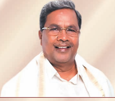
ಶ್ರೀ ಸಿದ್ದರಾಮಯ್ಯ ಸನ್ಮಾನ್ಯ ಮುಖ್ಯಮಂತ್ರಿಗಳು ಕರ್ನಾಟಕ ಸರ್ಕಾರ