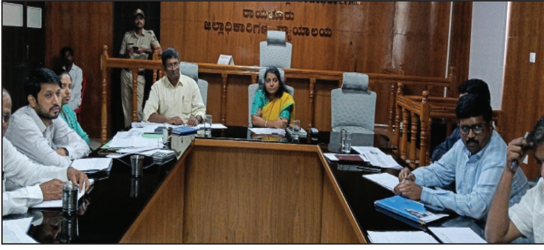
ಕಾಲಮಿತಿಯೊಳಗೆ ಜನರಿಗೆ ತಲುಪಿಸಬೇಕು. ಮತ್ತು ಮರಳು ಗಣಿಗಾರಿಕೆಯ ಮೇಲಿನ ಸರ್ಕಾರದ ಬಾಕಿ ಬಿದ್ದಿರುವ ಕಂದಾಯ, ದಂಡಗಳನ್ನು ಸಮರ್ಪಕವಾಗಿ ವಸೂಲಿ

ಪ್ರಗತಿ ಪರಿಶೀಲನಾ ಸಭೆಯ ಅಧ್ಯಕ್ಷತೆ ವಹಿಸಿ ಅವರು ಮಾತನಾಡಿದರು. ಜಿಲ್ಲೆಯ ಆಡಳಿತಾತ್ಮಕ ಸುಧಾರಣೆ, ಭೂ ದಾಖಲೆಗಳ ನಿರ್ವಹಣೆ ಮತ್ತು ಸಾರ್ವಜನಿಕ ಸೇವೆಗಳನ್ನು ಪರಿಣಾಮಕಾರಿಯಾಗಿ ಅನುಷ್ಠಾನಗೊಳಿಸಬೇಕು. ಪೋಡಿ, ದುರಸ್ತಿ, ಪಹಣಿ ತಿದ್ದುಪಡಿ, ಮತ್ತು ಭೂ ಒತ್ತುವರಿ ತೆರವು ಪ್ರಕರಣಗಳನ್ನು ತ್ವರಿತವಾಗಿ ವಿಲೇವಾರಿ ಮಾಡಲು ಅಗತ್ಯ ಕ್ರಮ ವಹಿಸಬೇಕೆಂದು ಜಿಲ್ಲಾಧಿಕಾರಿಗಳು ಸಂಬಂಧಿಸಿದ ಅಧಿಕಾರಿಗಳಿಗೆ ನಿರ್ದೇಶನ ನೀಡಿದರು. ಪಿಂಚಣಿಯೋಜನೆಗಳು, ಆರ್.ಟಿ.ಸಿ. ವಿತರಣೆ, ಜಾತಿ ಮತ್ತು ಆದಾಯ ಪ್ರಮಾಣಪತ್ರಗಳನ್ನು