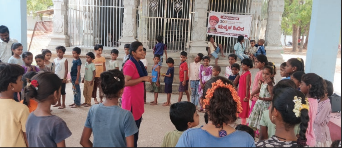
ಮತ್ತು ದಲಿತ ದಮನಿತ ಮಕ್ಕಳಿಗಾಗಿ ಶಾಲೆಯನ್ನು ತೆರೆದಿದ್ದರು. ಇಂದು ನಾವಾರೂ ಈ ಮಟ್ಟದ ಶಿಕ್ಷಣ ಪಡೆಯಲು ಸಾಧ್ಯವಾಗುತ್ತಿಲ್ಲ. ಶಿಕ್ಷಣವು ಪ್ರತಿಯೊಬ್ಬ ವ್ಯಕ್ತಿಗೂ ಉಚಿತವಾಗಿ ಮತ್ತು ಸಮಾನವಾಗಿ ಸಿಗಬೇಕು ಎಂಬುದು ಅವರ ಆಶಯವಾಗಿತ್ತು. ತಿಳಿಸಿದರು. ಇಂದಿನ ಶಿಕ್ಷಣ ವ್ಯವಸ್ಥೆಯ ಕುರಿತು ಕಳವಳ ವ್ಯಕ್ತಪಡಿಸಿದ ಅವರು, ಬಂದೆಡೆ ಶಿಕ್ಷಣವನ್ನು ವ್ಯಾಪಾರೀಕರಣ ಮಾಡುತ್ತಿವೆ. *ಕೆ.ವಿ.ಎಸ್ ಮ್ಯಾಟ್ರಿಕ್ ಹೆಸರಿನಲ್ಲಿ ಸಾವಿರಾರು ಸರ್ಕಾರಿ ಶಾಲೆಗಳನ್ನು ವಿಲೀನಗೊಳಿಸಿ ಮುಚ್ಚಲಾಗುತ್ತಿದೆ. ಇದು ಗ್ರಾಮೀಣ ಭಾಗದ ಬಡ ವಿದ್ಯಾರ್ಥಿಗಳನ್ನು ಶಿಕ್ಷಣದಿಂದ ವಂಚಿತರನ್ನಾಗಿ ಮಾಡುವ ಸಂಚು ಎಂದು ಹೇಳಿದರು. ಶಿಬಿರದಲ್ಲಿ ಮನೋರಂಜನೆ ಆಟಗಳು,