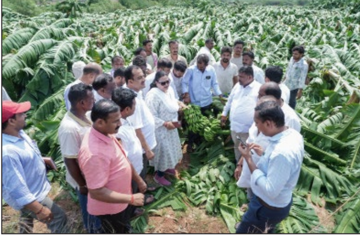
ಲಕ್ಷಕ್ಕೆ ಗುತ್ತಿಗೆ ಆಧಾರದ ಮೇಲೆ ಹೊಲ ಪಡೆದು ಉಳುಮೆ ಮಾಡಿದ್ದಾರೆ. ಇತ್ತ ಬೆಳೆ ಬೆಳೆ ಬೆಳೆಯಲು 2 ಲಕ್ಷ ರೂ.ವರೆಗೆ ಖರ್ಚು ಮಾಡಿದ್ದಾರೆ. ಹೀಗಾಗಿ ಸರ್ಕಾರ ಕೊಡುವ 22500 ರೂ. ಪರಿಹಾರ ಯಾವುದಕ್ಕೂ ಸಾಲು ವುದಿಲ್ಲ. ಕೂಡಲೇ ಪರಿಹಾರವನ್ನು 5 ಲಕ್ಷ ರೂ. ಗೆ ನಿರಿಸಿ ಕೈಗೆ ಬರುತ್ತದೆ ಎನ್ನುವಷ್ಟರಲ್ಲಿ ಅಕಾಲಿಕ ಮಳೆಗೆ ಬೆಳೆ ಹಾಳಾಗಿದೆ. ಸರ್ಕಾರ, ಹಾಳಾದ ಬೆಳೆಗೆ ಎಕರೆಗೆ 22,500 ರೂ. ಕೊಡಲು ಮುಂದಾಗಿದೆ. ಆದರೆ, ಇದು, ಸರಿಯಲ್ಲ. ಎಕರೆಗೆ ಕನಿಷ್ಠ 5 ಲಕ್ಷ ರೂ. ಪರಿಹಾರ ಕೊಡಬೇಕು. ಅಲ್ಲದೆ, ಬಹಳಷ್ಟು ಹಲವು ರೈತರು ವರ್ಷಕ್ಕೆ 1.5 ಸಂಕಷ್ಟ ಎದುರಾಗಿದೆ. ಸರ್ಕಾರ, ಈ ವಿಚಾರದಲ್ಲಿ ನಿರ್ಲಕ್ಷ್ಯ ಮಾಡಲೇ ಕೂಡಲೇ ಹೆಚ್ಚಿನ ಮಟ್ಟದಲ್ಲಿ ಪರಿಹಾರ ವಿತರಣೆಗೆ ಕ್ರಮ ವಹಿಸಬೇಕೆಂದು ಒತ್ತಾಯಿಸಿದರು. ಗ್ರಾಮೀಣ ಹಾಗೂ ನಗರ ಮಂಡಲದ ಬಿಜೆಪಿ ಅಧ್ಯಕ್ಷರಾದ ವೀರೇಶ್ ಸಜ್ಜನ್ ಹಾಗೂ ಅಮರೇಶ್ ಮುರಳಿ, ಮುಖಂಡರಾದ ಅಪ್ಪಣ್ಣ ಪದಕಿ, ಮಹಾಂತರಾಜ್ ಪಾಟೀಲ್ ಮೈನಳ್ಳಿ , ಚಂದ್ರಶೇಖರ ಕವಲೂರ್, ಹಲವರ್ತಿ ಬೆಳೆಗಲು ಸಂಪೂರ್ಣ ಹಾಳಾಗಿವೆ. ರೈತರ ಕಷ್ಟವನ್ನು ನೋಡಲಾಗುತ್ತಿಲ್ಲ. ನಮಗಲ್ಲ ಅನ್ನ ಕೊಡುವ ರೈತನಿಗೆ

ಮಲ್ಲಮ್ಮ ನುಡಿ ವಾರ್ತೆ ಕೊಪ್ಪಳ ಜಿಲ್ಲೆಯ ವಿವಿಧೆಡೆ ಸುರಿದ ಮಳೆಗೆ ಹಾಳಾಗಿರುವ ತೋಟಗಾರಿಕೆ ಹಾಗೂ ಕೃಷಿ ಬೆಳೆ ಬೆಳೆದ ರೈತರಿಗೆ ಸರ್ಕಾರ ಕೂಡಲೇ ಪ್ರತಿ ಎಕರೆಗೆ 5 ಲಕ್ಷ ರೂ. ಪರಿಹಾರ ಕೊಡಬೇಕು ಎಂದು ಜಿಲ್ಲಾ ಬಿಜೆಪಿ ನಾಯಕರು ಒತ್ತಾಯಿಸಿದರು. ತಾಲೂಕಿನ ಹೊಸಹಳ್ಳಿ, ಮುದ್ದಾಬಳ್ಳಿ, ಹ್ಯಾಟ ಗ್ರಾಮದ ರೈತರ ಹೊಲಗಳಿಗೆ ಭಾನುವಾರ ಸುರಿದ ಮಳೆಗೆ ಅನ್ನದಾತರೊಂದಿಗೆ ಭೇಟಿ ನೀಡಿ, ಪರಿಶೀಲಿಸಿದರು. ಏಕಾಏಕಿ ಸುರಿದ ಮಳೆಗೆ ಬೆಳೆ ಹಾಳಾಗಿರುವುದನ್ನು ರೈತರು ಬಿಜೆಪಿ ನಾಯಕರಿಗೆ ತಿಳಿಸಿದರು. ಬಾಳೆ ಬೆಳೆ, ಕಬ್ಬು, ಎಲೆ ನೂರಾರು ಎಕರೆ ಪ್ರದೇಶದಲ್ಲಿ ಹಾಳಾಗಿರುವುದನ್ನು ಪರಿಶೀಲನೆ ಮಾಡಿದರು. ಈ ವೇಳೆ ಮಾತನಾಡಿದ ಕೊಪ್ಪಳ ಲೋಕಸಭಾ ಕ್ಷೇತ್ರದ ಸಂಸದರಾದ ಅಧ್ಯಕ್ಷಿಣಿ ಡಾ.ಬಸವರಾಜ್ ಕ್ಯಾವಟರ್ ಮಾತನಾಡಿ, ರೈತರ ಕಷ್ಟ ಪಟ್ಟು ಬೆಳೆದ ಬೆಳೆಗಳೆಲ್ಲ ಹಾಳಾಗಿರುವುದು ಸಂಕಟ ತಂದಿದೆ ಎಕರೆಗೆ 5 ಲಕ್ಷ ರೂ. ಪರಿಹಾರ ಕೊಡುವುದನ್ನು 5 ಲಕ್ಷ ರೂ. ಗೆ ನಿರಿಸಿ ಕೈಗೆ ಬರುತ್ತದೆ ಎನ್ನುವಷ್ಟರಲ್ಲಿ ಅಕಾಲಿಕ ಮಳೆಗೆ ಬೆಳೆ ಹಾಳಾಗಿದೆ. ಸರ್ಕಾರ, ಹಾಳಾದ ಬೆಳೆಗೆ ಎಕರೆಗೆ 22,500 ರೂ. ಕೊಡಲು ಮುಂದಾಗಿದೆ. ಆದರೆ, ಇದು, ಸರಿಯಲ್ಲ. ಎಕರೆಗೆ ಕನಿಷ್ಠ 5 ಲಕ್ಷ ರೂ. ಪರಿಹಾರ ಕೊಡಬೇಕು. ಅಲ್ಲದೆ, ಬಹಳಷ್ಟು ಹಲವು ರೈತರು ವರ್ಷಕ್ಕೆ 1.5