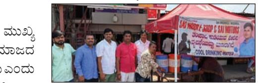
ಸೇವೆ ಹಾಗೂ ಸಹಾಯ ಮಾತ್ರ ಜನಮಾನಸದಲ್ಲಿ ಶಾಶ್ವತವಾಗಿ ಉಳಿಯುತ್ತವೆ. ಸಮಾಜ ಸೇವೆಯಿಂದ ಮಾತ್ರ ಸಂಘ ಸಂಸ್ಥೆಗಳ ಸ್ಥಾಪನೆ ಸಾರ್ಥಕವಾಗುತ್ತದೆ ಎಂದು ಹೇಳಿದರು.