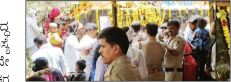
ನಂದರಿಯಾಗದಂತೆ ದೇವಸ್ಥಾನ ಸಮಿತಿ ಹಾಗೂ ಸ್ಥಳೀಯ ದಾನಿಗಳು ವಿಶೇಷ ?ಕಡು ಬಿಸಿಲಿನ ತಾಪ ವ್ಯವಸ್ಥೆ ಮಾಡಿದ್ದರು.

ತಾಲೂಕಿನ ಖಾನಾಪುರ ಸಮೀಪದಲ್ಲಿರುವ ಪ್ರಸಿದ್ಧ ಶನಿ ಮಹಾತ್ಮ ದೇವಸ್ಥಾನಕ್ಕೆ ಶನಿವಾರದ ಅಮಾವಾಸ್ಯೆ ಅಂಗವಾಗಿ ಬಿರುಬಿಸಿಲನ್ನೂ ಲೆಕ್ಕಿಸದೆ ಭಕ್ತಸಾಗರವೇ ಹರಿದು ಬಂದಿತ್ತು. ದೇವಸ್ಥಾನದ ಆವರಣವು ಭಕ್ತರ ಜಯಘೋಷಗಳಿಂದ ಮೊಳಗುತ್ತಿತ್ತು. ಮಂಜಾನೆಯಿಂದಲೇ ದೀಪಾಲಂಕಾರ, ದರ್ಶನ 9ನೇ ಸುಕಿನ 4 ಗಂಟೆಯಿಂದಲೇ ದೇವಸ್ಥಾನದ ಆವರಣದಲ್ಲಿ ಭಕ್ತರು ಸಾಲಿನಲ್ಲಿ ನಿಂತಿರುವುದು ಕಂಡುಬಂದಿತ್ತು.