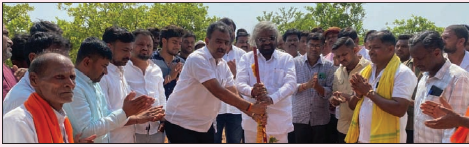
ಟ್ರಿಪಿಂಗ್ ಸಮಸ್ಯೆ ತಗ್ಗಲಿದೆ ಎಂದರು.