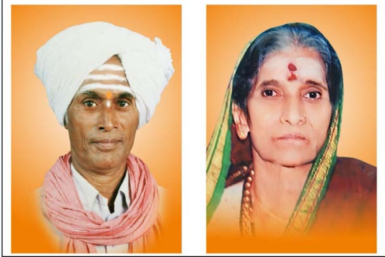
ಪ್ರಧಾನ ನಡೆಯಲಿದೆ. ಪ್ರಸಿದ್ಧ ಹಾರ್ಮೋನಿಯಂ ವಾದಕರಾದ ಬೀದರನ ಪಂ. ರಾಜೇಂದ್ರ ಸಿಂಗ್ ಪವಾರ ಅವರಿಗೆ ರಾಷ್ಟ್ರೀಯ ಮತ್ತು ಮುಖ್ಯಚಳಂಬಿಯ ಶ್ರೀ ರೇವಪ್ರಪಾಂಚಾಳ ಇವರಿಗೆ ಪ್ರಶಸ್ತಿಗಳನ್ನು ನೀಡಲಾಗುವುದು.

ಸತ್ಯಂಕಲ್ಪದ ಫಲವಾಗಿ ಗೋರಟಾದಲ್ಲಿ ಭವ್ಯ ಶ್ರೀ ಸಂಗೀತ ರುದ್ರೇಶ್ವರ ದೇವಾಲಯ ತಲೆಯೆತ್ತಿ ನಿಂತಿದೆ. ಜಾತ್ರಾ ಮತ್ತು ಪೂಜ್ಯರ ಸಂಸ್ಕರಣೋತ್ಸವದ ಅಂಗವಾಗಿ ಅನೇಕ ಧಾರ್ಮಿಕ ಸಾಂಸ್ಕೃತಿಕ ಕಾರ್ಯಕ್ರಮಗಳನ್ನು ಹಮ್ಮಿಕೊಳ್ಳಲಾಗಿದೆ. 19 ರಂದು ಬೆಳಿಗ್ಗೆ 9 ಗಂಟೆಗೆ ಶ್ರೀ ಸಂಗೀತ ರುದ್ರೇಶ್ವರ ಮತ್ತು ಪೂಜ್ಯರ ಗದ್ದುಗೆಗೆ ಶ್ರೀ ಸಂಗೀತ ರುದ್ರಾಭಿಷೇಕ ಮಹಾಪೂಜಾ ಮಹಾ ಪ್ರಸಾದ ನೆರವೇರುವುದು. ಮಧ್ಯಾಹ್ನ 1: 15 ಗಂಟೆಗೆ ಶ್ರೀಶೈಲ ಶ್ರೀ ಅಕ್ಕಮಹಾದೇವಿ ಚೈತನ್ಯ ಸೀತದ ಅಧಿಪತಿಗಳಾದ ಮಹಾಯೋಗಿನಿ ಪೂಜ್ಯಶ್ರೀ ಕರುಣಾದೇವಿ ಮಾತಾ ಅವರ ದಿವ್ಯ ಸಾನಿಧ್ಯ ಮತ್ತು ಸಂಸ್ಥಾನದ ಅಧಿಪತಿಗಳಾದ ಪೂಜ್ಯಪ. ಬ್ರ. ಡಾ : ರಾಜಶೇಖರ ಶಿವಾಚಾರ್ಯ ಸ್ವಾಮಿಗಳು ಹಿರೇಮಠ ಸಂಸ್ಥಾನ ಬೇಮಳಬೆಡೆ ಅವರ ಘನ ನೇತೃತ್ವದಲ್ಲಿ ಸಂಸ್ಕರಣೋತ್ಸವ ಉದ್ಘಾಟನಾ ಮತ್ತು ಪಂ. ವಿರೂಪಾಕ್ಷ ಸಮಾನ್ ರಾಷ್ಟ್ರೀಯ ಮತ್ತು ರಾಜ್ಯ ಪ್ರಶಸ್ತಿ