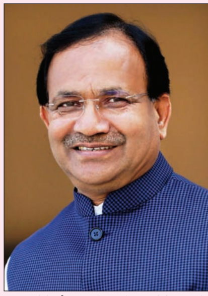
ಅದರಂತೆ ಮುದ್ದು ಪ್ರಧಾನಿಗಳು ಅವರ ಬೆಂಗಳೂರು ವಾಹನಗಳು ಕಡಿಮೆ ಮಾಡಿ ಎಲ್ಲರಿಗೂ ಮಾದರಿಯಾಗಿದ್ದಾರೆ. ಪ್ರಧಾನಿಯವರ ಸಲಹೆಯಂತೆ ಈಗಾಗಲೇ ಬಿಜಿಪಿ ಪಕ್ಷ ಆಡಳಿತದಲ್ಲಿರುವ ರಾಜ್ಯಗಳಲ್ಲಿ

• ಮಲ್ಲಮ್ಮ ನುಡಿ ವಾರ್ತೆ ಬೀದರ್ ದೇಶದ ಪ್ರಧಾನಿ ಸನ್ಮಾನ್ಯ ಶ್ರೀ ನರೇಂದ್ರ ಮೋದಿಯವರು, ದೇಶದ ಆರ್ಥಿಕ ಹಿತಾಸಕ್ತಿಯನ್ನು ಗಮನದಲ್ಲಿಟ್ಟುಕೊಂಡು ದೇಶವನ್ನು ಉದ್ದೇಶಿಸಿ ನೀಡಿರುವ ಸಲಹೆಗಳಲ್ಲಿ ಒಂದಾದ ತೈಲ ಉಳಿತಾಯದ ಕುರಿತಾಗಿ ನೀಡಿರುವ ಸಲಹೆಯನ್ನು ರಾಜ್ಯದಲ್ಲಿ ತಮ್ಮನ್ನು ಒಳಗೊಂಡಂತೆ ಎಲ್ಲಾ ಸಚಿವರಿಗೆ, ಅಧಿಕಾರಿಗಳಿಗೆ ಈ ನಿಟ್ಟಿನಲ್ಲಿ ಸೂಕ್ತ ನಿರ್ದೇಶನ ನೀಡಬೇಕೆಂದು ಕೇಂದ್ರದ ಮಾಜಿ ಸಚಿವ ಭಗವಂತ ಖೂಬಾ ಮುಖ್ಯಮಂತ್ರಿ ಸಿದ್ದರಾಮಯ್ಯನವರಿಗೆ ಪತ್ರ ಬರೆದು ಮನವಿ ಮಾಡಿಕೊಂಡಿದ್ದಾರೆ. ಇತರ ರಾಜ್ಯಗಳಲ್ಲಿ ನಡೆಯುತ್ತಿರುವ ಯುದ್ಧಗಳ ಹಿನ್ನೆಲೆಯಲ್ಲಿ ಅನೇಕ ರಾಜ್ಯಗಳು ಈಗಾಗಲೇ ಆರ್ಥಿಕವಾಗಿ ಕಂಗೆಟ್ಟಿವೆ. ಆದರೆ ಭಾರತ ದೇಶವು ಆರ್ಥಿಕವಾಗಿ ಸದೃಢವಾಗಿದೆ, ದೇಶದ ಜನತೆ ಸುರಕ್ಷತೆಯಿಂದ ಮತ್ತು ನೆಮ್ಮದಿಯಿಂದ ಬದುಕುತ್ತಿದ್ದಾರೆ. ಆದರೂ ಸಹ ಮುಂದಾಲೋಚನೆಯಿಂದ, ಕಳೆದ ವಾರ ಪ್ರಧಾನಿಗಳು ದೇಶದ ಜನರಿಗೆ ಕೆಲವೊಂದು ಸಲಹೆಗಳು ನೀಡಿದ್ದಾರೆ ಮತ್ತು ಪಾಲಿಸುವಂತೆ ಕೋರಿದ್ದಾರೆ ಎಂದು ಪತ್ರದಲ್ಲಿ ತಿಳಿಸಿದ್ದಾರೆ.