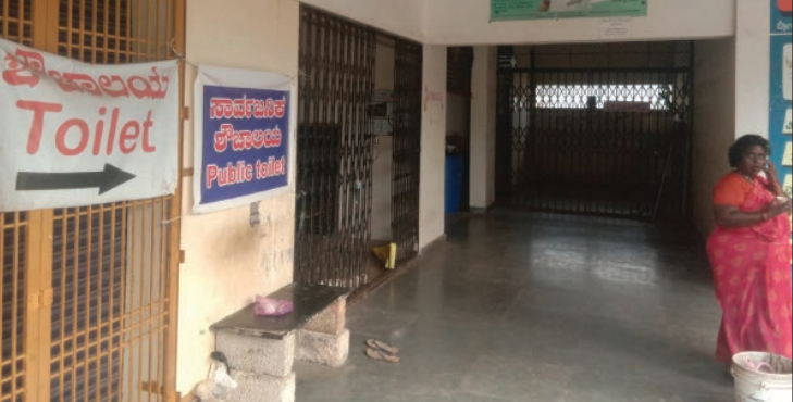
ಶೌಚಾಲಯವನ್ನು ಬಳಸಲು ಸಾಧ್ಯವಿಲ್ಲದ ಪರದಾಟುತ್ಪಿದ್ಧು ಸ್ಥಿತಿ ನಿರ್ಮಾಣವಾಗಿದೆ. ಈ ರೀತಿಯ ಅವ್ಯವಸ್ಥೆಗೆ ಮುಖ್ಯ ಕಾರಣ ಜನಪ್ರತಿನಿಧಿಗಳ ಆಡಳಿತ ವೈಫಲ್ಯವಾಗಿದೆ. ಚುನಾಯಿತಿ ಪ್ರತಿನಿಧಿಗಳು ತಾಲೂಕಿನ ಸಮಸ್ಯೆಗಳನ್ನು ಪರಿಹರಿಸುವ ಬದಲು ಪಕ್ಷದ ರಾಜ್ಯಗಳಿಗೆ ಹೋಗಿ ಪ್ರಚಾರ ಪರದಾಟುತ್ಪಿದ್ಧು ಸ್ಥಿತಿ ನಿರ್ಮಾಣವಾಗಿದೆ. ಈ ರೀತಿಯ ಅವ್ಯವಸ್ಥೆಗೆ ಮುಖ್ಯ ಕಾರಣ ಜನಪ್ರತಿನಿಧಿಗಳ ಆಡಳಿತ ವೈಫಲ್ಯವಾಗಿದೆ. ಅತಿ ಹೆಚ್ಚು ಜನ ಮಧುಮೇಹ ರೋಗದಿಂದ ಬಳಲುತ್ತಿದ್ದು ನಗರದ ಮಧ್ಯಭಾಗದಲ್ಲಿರುವ