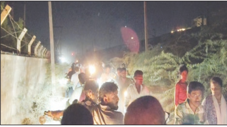
ವಾಹನಗಳ ದಟ್ಟಣೆ ಹೆಚ್ಚಾಗಿ, ತಾಲಾ ಮಕ್ಕಳು, ಉದ್ಯೋಗಿಗಳು ಮತ್ತು ಅಂಬುಲೆನ್ಸ್‌ಗಳಿಗೂ ತೊಂದರೆ ಉಂಟಾಗುತ್ತಿದೆ ಎಂದು ಸ್ಥಳೀಯರು ಆರೋಪಿಸಿದ್ದಾರೆ. ಸ್ಥಳೀಯರ ಪ್ರಕಾರ, ರೈಲು ಸಂಚಾರ ಹೆಚ್ಚಾದಾಗ ಗೇಟ್ ದೀರ್ಘ ಸಮಯ

ಪ್ರಯಾಣಿಕರು ಸಂಚಾರ ಮಾಡುವುದಕ್ಕೆ ಹೋದರೆ ಆ ರಸ್ತೆ ಮಾರ್ಗದಲ್ಲಿ ಲೈಟಿನ ಸಮಸ್ಯೆ ಹಾಗೂ ಕುಂಡಿಗಳ ಬಿದ್ದು ಸಂಪೂರ್ಣ ದುರಸ್ತಿಯಲ್ಲಿ ಇದೆ. ಅನೇಕ ಜನ ಅದೇ ರಸ್ತೆಯಲ್ಲಿ ಸಂಚಾರ ಹೋಗಿ ಗಂಟೆಗಟ್ಟಿ ಟ್ರಾಫಿಕ್ ಜಾಮ್ ಆಗಿ ಪ್ರಯಾಣಿಕರು. ತುಂಬಾ ತೊಂದರೆಯಲ್ಲಿ ಸಿಲುಕಿಕೊಂಡಿದ್ದಾರೆ. ಅನೇಕ ಪ್ರಯಾಣಿಕರು ಬಳ್ಳಾರಿ ಟ್ರಾಫಿಕ್ ಅಧಿಕಾರಿಗಳಿಗೆ ಈ ಸಮಸ್ಯೆ ಬಗ್ಗೆ ತಿಳಿಸಿದರೆ ಆ ಸಮಸ್ಯೆ ರೈಲ್ವೆ ಇಲಾಖೆ ಅಧಿಕಾರಿಗಳು ಪರಿಹರಿಸಬೇಕೆಂದು ಟ್ರಾಫಿಕ್ ಅಧಿಕಾರಿಗಳು ಉತ್ತರ ಕೊಡುತ್ತಿರುವುದು ಕೇಳಿ ಬರುತ್ತದೆ. ರೈಲ್ವೆ ಗೇಟ್ ಬಳಿ ನಿರಂತರ ಟ್ರಾಫಿಕ್ ಜಾಮ್ ಸಮಸ್ಯೆಯಿಂದ ಸಾರ್ವಜನಿಕರು ತೀವ್ರ ಸಂಕಷ್ಟ ಅನುಭವಿಸುತ್ತಿದ್ದಾರೆ. ವಿಶೇಷವಾಗಿ ಬೆಳಿಗ್ಗೆ ಮತ್ತು ಸಂಜೆ ಪೀಕ್ ಅವಧಿಯಲ್ಲಿ