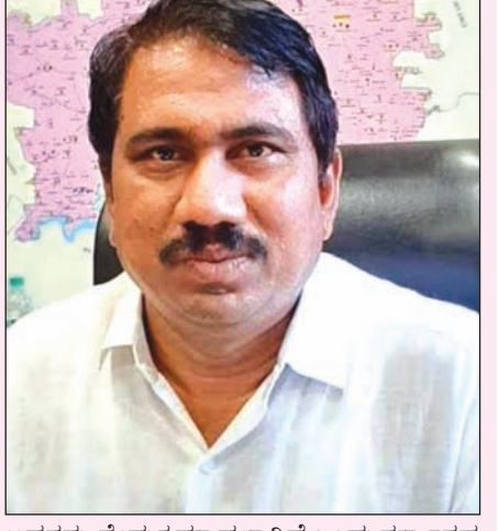
ಅವರನ್ನು ನೇಮಕ ಮಾಡಲಾಗಿದೆ ಎಂದು ಸರ್ಕಾರದ ಅಧಿಸೂಚನೆಯಲ್ಲಿ ತಿಳಿಸಲಾಗಿದೆ.