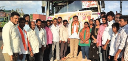
ಭಾಗ್ಯಲಕ್ಷ್ಮಿ ಬಾಂಡ್, ವೃದ್ಧಾಪ್ಯ ವೇತನ ಸೇರಿದಂತೆ ಹಲವು ಯೋಜನೆಗಳನ್ನು ಜಾರಿಗೆ ತಂದಿದ್ದು, ಸಾಮಾನ್ಯ ಜನರ ಜೀವನಮಟ್ಟ ಸುಧಾರಣೆಗೆ ಕಾರಣವಾಗಿದೆ ಎಂದು ಹೇಳಿದರು. ಪಕ್ಷವನ್ನು ಅಧಿಕಾರಕ್ಕೆ ತರುವಲ್ಲಿ ಯಡಿಯೂರಪ್ಪ ಅವರ ಪಾತ್ರ ಅಪಾರವಾಗಿದ್ದು, ಅವರ ನಾಯಕತ್ವ ಮತ್ತು ಹೋರಾಟಗಳು ಹಲವಾರು ಕಾರ್ಯಕ್ರಮಗಳಿಗೆ ಪ್ರೇರಣೆಯಾಗಿವೆ. ಈ ಅಭಿಮಾನೋತ್ಸವ ಕಾರ್ಯಕ್ರಮಕ್ಕೆ ಭಾರೀ ಪ್ರಮಾಣದಲ್ಲಿ ಜನಸಾಗರ ಸೇರುವ ನಿರೀಕ್ಷೆಯಿದೆ ಎಂದು ಅವರು ವಿಶ್ವಾಸ ವ್ಯಕ್ತಪಡಿಸಿದರು. ಹಿಂದೆ ಕರ್ನಾಟಕದಲ್ಲಿ ಬಿಜೆಪಿ ಅಧಿಕಾರಕ್ಕೆ ಬರಲು ಯಡಿಯೂರಪ್ಪ ಅವರ ಶ್ರಮ ಮಹತ್ವದ್ದಾಗಿದೆ. ಈಗ ಮೂರು ರಾಜ್ಯಗಳಲ್ಲಿ ಬಿಜೆಪಿ ಸಾಧಿಸಿರುವ ಭರ್ಜರಿ ಗೆಲುವಿನಂತೆ, ಕರ್ನಾಟಕದಲ್ಲಿಯೂ 2028ರಲ್ಲಿ ಪಕ್ಷ ಅಧಿಕಾರಕ್ಕೆ ಬರಲಿದೆ ಎಂದು ಹೇಳಿದರು.