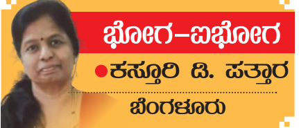
ಭೋಜ-ಐಭೋಜ • ಕನ್ನಡಿ. ಡಿ. ಹತ್ತಾರ ಬೆಂಗಳೂರು