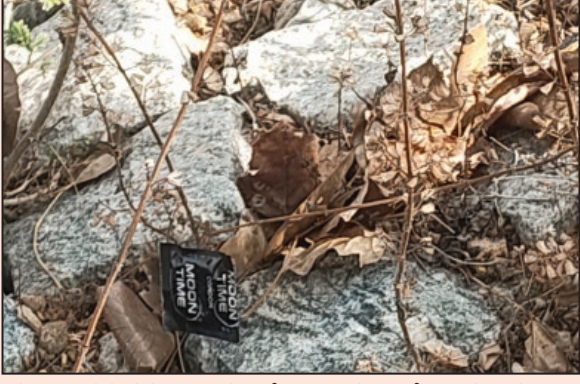
ಮುಖಂಡರುಗಳು ಒಂದು ಪೋನ್ ಮಾಡಿದ್ದ ಸಾಕು ಪ್ರವಾಸಿ ಮಂದಿರ ಬುಕಿ ಆಗಿ ಬಿಡುತ್ತದೆ