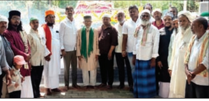
ಪ್ರತಿಯೊಬ್ಬರೂ ಧಾರ್ಮಿಕ ಕಾರ್ಯಕ್ರಮಗಳಲ್ಲಿ ತೊಡಗಿಸಿಕೊಳ್ಳುವುದರ ಮೂಲಕ ಮಾನಸಿಕ ಶಾಂತಿ, ನೆಮ್ಮದಿಯನ್ನು ಪಡೆಯಲು ಸಾಧ್ಯ ಎಂದರು. ಭಕ್ತಿಗೆ ಅನ್ನ ಸಂತಾಪಣೆ ಏರ್ಪಡಿಸಲಾಗಿತ್ತು.