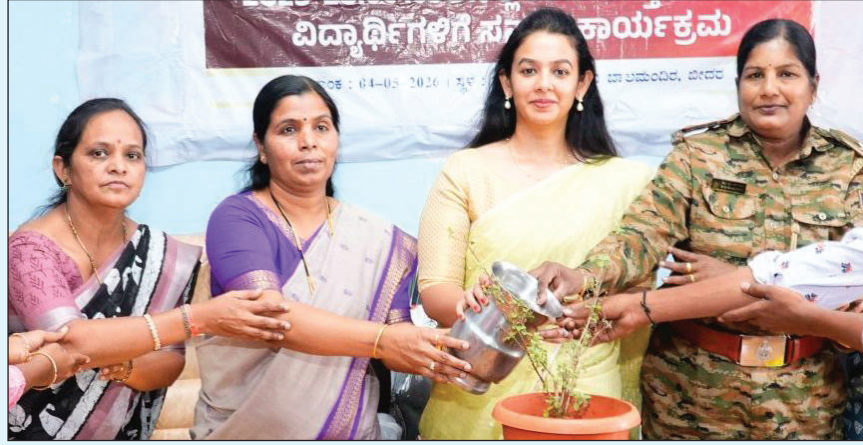
ಮಾಡಿ ಪಿ.ಹೆಚ್.ಡಿ ಮಾಡುತ್ಯೇನಿ. ನೀವು ಕೂಡ ಎದೆಗುಂದದೆ ನಿಮ್ಮ ಜೀವನದಲ್ಲಿ ಸಾಧನೆ ಮಾಡಬೇಕು ನಿಮಗೆ ಯಾವಾಗಲೂ ನನ್ನ ಬೆಂಬಲ ಇರುತ್ತದೆಂದರು.

ರಾಜ್ಯದ ಎಲ್ಲಾ ಕಡೆ ಇಂತಹ ಕಾರ್ಯಕ್ರಮ ಆಗಬೇಕು. ಮಕ್ಕಳು ಶ್ರಮ ಪಟ್ಟು ಕಲಿಕಾಗೆ ಮಾತ್ರ ಇಂತಹ ಸಾಧನೆ ಮಾಡಲು ಸಾಧ್ಯ. ನಾನು ಕೂಡ ತಂದೆ ಇಲ್ಲದೇ ಬೆಳೆದವಳು ಜೀವನದಲ್ಲಿ ತುಂಬಾ ಕಷ್ಟಪಟ್ಟು ಓದಿ ಇಂಜಿನಿಯರಿಂಗ್