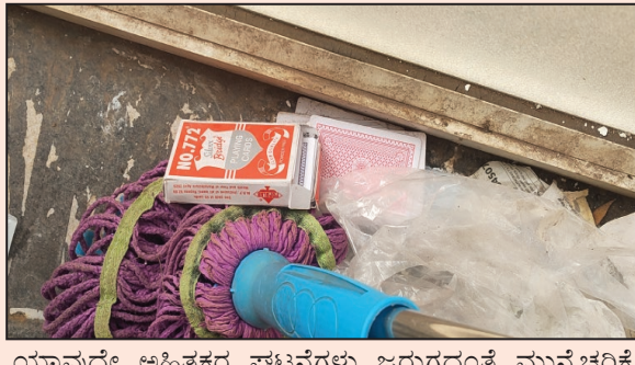
ಯಾವುದೇ ಅಹಿತಕರ ಘಟನೆಗಳು ಜರುಗದಂತೆ ಮುನ್ನೆಚ್ಚರಿಕೆ ವಹಿಸಬೇಕಾಗಿದೆ