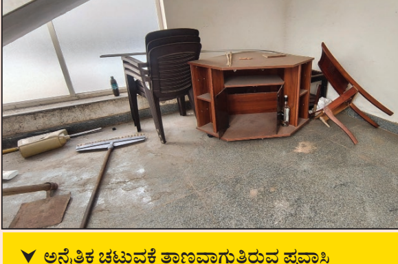
ಅನ್ಯತಿಕ ಚಟುವಟಿಕೆ ತಾಣವಾಗುತ್ತಿರುವ ಪ್ರವಾಸಿ ಮಂದಿರ