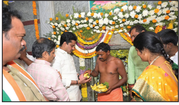
ಮಲ್ಲಮ್ಮ ನುಡಿ ವಾರ್ತೆ, ಬಳ್ಳಾರಿ