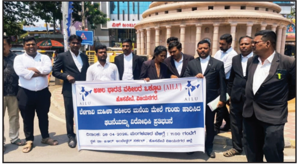
ಮಲ್ಲಮ್ಮ ನುಡಿ ವಾರ್ತೆ, ವಿಜಯನಗರ

ಜಿಲ್ಲೆ ಹೊಸಪೇಟೆ ವಿ.ಪಿ.ಎಲ್. 27 ನಗರದಲ್ಲಿ ಅಖಿಲ ಭಾರತ ವಕೀಲರ ಸಂಘದ ವತಿಯಿಂದ ಪೊಲೀಸ್ ಇನ್‌ಸ್ಟಿಟ್ಯೂಟ್‌ನಲ್ಲಿ ಉಚಿತವಾಗಿ ಮನವಿ ಪತ್ರ ನೀಡಿ ಬೃಹತ್ ಪ್ರತಿಭಟನೆ, ಬೆಳಗಾವಿ ಮಹಿಳಾ ವಕೀಲರ ಮನೆಯ ಮೇಲೆ ಗುಂಡು ಹಾರಿಸಿದ ಘಟನೆ ವಿರೋಧಿಸಿ ಪ್ರತಿಭಟನೆ ನಡೆಸುವ ಮೂಲಕ ದಿನಾಂಕ 26.4.2026 ರಂದು ಬೆಳಗಾವಿಯಲ್ಲಿ ನಡೆಸುವ ಜಾವದಲ್ಲಿ ಅಪರಿಚಿತ ವ್ಯಕ್ತಿಗಳು ಮಹಿಳಾ ವಕೀಲರ ಮನೆಯ ಮೇಲೆ ಗುಂಡಿನ ದಾಳಿ ಮಾಡಿದರು. ಈ ಘಟನೆಯಿಂದ ಯಾವುದೇ ಪ್ರಮಾದ ಉಂಟಾಗಿಲ್ಲವಾದರೂ ಬೆದರಿಕೆ ಸಂದೇಶ ರವಾನಿಸುವ ದಿನಯಲ್ಲಿ ಈ ಘಟನೆ ವಕೀಲ ಸಮುದಾಯದ ಮೇಲೆ ಗಂಭೀರ ಬೆದರಿಕೆಯಾಗಿದೆ. ಈ ಹಿನ್ನೆಲೆಯಲ್ಲಿ ಕೆಳಕಂಡ ಬೇಡಿಕೆಗಳನ್ನು ಈಡೇರಿಸುವಂತೆ ಒತ್ತಾಯಿಸಿ ದಿನಾಂಕ 28.4.2026 ರಂದು ಮಂಗಳವಾರ ಬೆಳಿಗ್ಗೆ 11.00 ಗಂಟೆಗೆ ಅಂಬೇಡ್ಕರ್ ಸರ್ಕಲ್ ಬಳಿ ಪ್ರತಿಭಟನೆ ನಡೆಸಲಾಯಿತು.