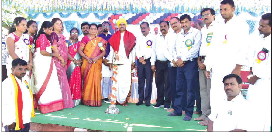
ಮಲ್ಲಮ್ಮ ನುಡಿ ವಾರ್ತೆ, ಕೊಪ್ಪಳ