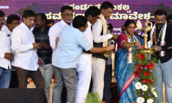
ಸಂಡೂರು ಸಂಕಲ್ಪ ಸಮಾವೇಶ

ವಲಯಗಳ ಜನರನ್ನು ಮುಖ್ಯವಾಹಿನಿಗೆ ತರಲಾಗುತ್ತಿದೆ ಎಂದರು. ಅಮೆಜಾನ್, ಜೊಮ್ಮಾಟೊ, ಸ್ಪಿಗ್ಲಿ ಮುಂತಾದ ಆನ್‌ಲೈನ್ ಕಂಪನಿಗಳಲ್ಲಿ ಕೆಲಸ ಮಾಡುವ ಡೆಲಿವರಿಬಾಯ್‌ಗಳ ಹಿತರಕ್ಷಣೆಗಾಗಿ ಭಾರತದಲ್ಲೇ ಮೊದಲ ಬಾರಿಗೆ ಕರ್ನಾಟಕದಲ್ಲಿ ಗಿಗ್ ವರ್ಕರ್ಸ್ ಬಿಲ್ ಕಾನೂನು ತರಲಾಗಿದೆ. ಚಾಲಕರು ಮತ್ತು ಕ್ಷೀನರ್‌ಗಳ ಹಿತರಕ್ಷಣೆಯಿಂದ ಸ್ಟಾರ್ಟ್ ಕಾರ್ಡ್ ವಿತರಿಸುವ ಟ್ರಾನ್ಸ್‌ಪಾರ್ಟ್ ಬಿಲ್ ಯೋಜನೆ ಜಾರಿಯಲ್ಲಿದೆ. ಅದರಂತೆ ಚಿತ್ರರಂಗದ ಕಾರ್ಮಿಕರು ಹಾಗೂ ಮನೆಗೆಲಸ ಮಾಡುವ ಮಹಿಳೆಯರ ಸಾಮಾಜಿಕ ಭದ್ರತೆಗಾಗಿ ಸಿನಿ ಬಿಲ್ ಮತ್ತು ಡೊಮೆಸ್ಟಿಕ್ ಬಿಲ್ ನಂತರ ಹೊಸ ಕಾನೂನುಗಳನ್ನು ರೂಪಿಸಲಾಗುತ್ತಿದೆ ಎಂದು ತಿಳಿಸಿದರು. ಇಡೀ ದೇಶದಲ್ಲೇ ಇಂತಹ ಬೃಹತ್ ಜನಪರ ಯೋಜನೆಗಳು ಎಲ್ಲೆಯೂ ಇಲ್ಲ. ಗ್ಯಾರಂಟಿ ಯೋಜನೆಗಳಿಗಾಗಿ ವರ್ಷಕ್ಕೆ ಸುಮಾರು 60,000 ಕೋಟಿ ರೂಪಾಯಿಗಳನ್ನು ವ್ಯಯಿಸಲಾಗುತ್ತಿದೆ. ಐದು ವರ್ಷಕ್ಕೆ ಇದು ಸುಮಾರು 3 ಲಕ್ಷ ಕೋಟಿ