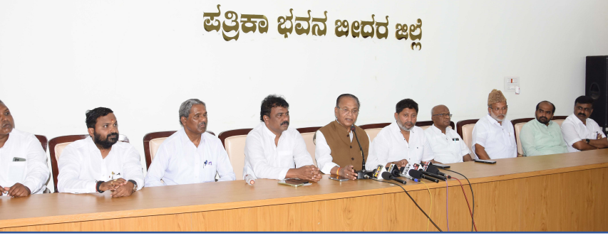
ಪತ್ರಿಕಾ ಭವನ ಜೀವರ ಜಿಲ್ಲಾ