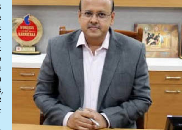
ಮಲ್ಲಮ್ಮ ನುಡಿ ವಾರ್ತೆ

ಕೊಪ್ಪಳ : ಎರಡನೇ ಹಂತದ ದ್ವಿತೀಯ ಪಿಯುಸಿ ವಾರ್ಷಿಕ ಪರೀಕ್ಷೆಗಳು ಏಪ್ರಿಲ್ 30 ರಿಂದ ಮೇ 13 ರವರೆಗೆ ಕೊಪ್ಪಳ ಜಿಲ್ಲೆಯ ವಿವಿಧ ಪರೀಕ್ಷಾ ಕೇಂದ್ರಗಳಲ್ಲಿ ನಡೆಯಲಿದ್ದು, ಪರೀಕ್ಷೆಗಳು ಸುಗಮ ಹಾಗೂ ಶಾಂತಿಯುತವಾಗಿ ನಡೆಯುವ ಉದ್ದೇಶದಿಂದ ಪರೀಕ್ಷಾ ಕೇಂದ್ರದ ಸುತ್ತಲೂ 200 ಮೀಟರ್ ವ್ಯಾಪ್ತಿಯಲ್ಲಿ ನಿಷೇಧಾಜ್ಞೆ ಜಾರಿಗೊಳಿಸಿ ಜಿಲ್ಲಾಧಿಕಾರಿಗಳಾದ ಡಾ. ಸುರೇಶ್ ಬಿ. ಇಟ್ಟಾಳ ಅವರು ಆದೇಶ ಕೊರಡಿಸಿದ್ದಾರೆ. ದ್ವಿತೀಯ ಪಿಯುಸಿ ವಾರ್ಷಿಕ ಪರೀಕ್ಷೆ-2ರ ಪರೀಕ್ಷೆಗಳು ಏಪ್ರಿಲ್ 30 ರಿಂದ ಮೇ 13 ರವರೆಗೆ ಬೆಳಿಗ್ಗೆ 10 ಗಂಟೆ ಯಿಂದ ಮಧ್ಯಾಹ್ನ 1 ಗಂಟೆಯವರೆಗೆ ಜಿಲ್ಲೆಯ ಕೊಪ್ಪಳದ ಬಾಲಕಿಯರ ಸರಕಾರಿ ಪದವಿ ಪೂರ್ವ ಕಾಲೇಜು, ಗಂಗಾವತಿಯ ಬಾಲಕರ ಸರಕಾರಿ ಪದವಿ ಪೂರ್ವ ಕಾಲೇಜು, ಕುಷ್ಟಗಿಯ ಬಾಲಕಿಯರ ಸರಕಾರಿ ಪದವಿ ಪೂರ್ವ ಕಾಲೇಜು, ಎಲ್ಲಬುರ್ಗಾದ ಸರಕಾರಿ ಪದವಿ ಪೂರ್ವ ಕಾಲೇಜು ಮತ್ತು ಕಾರಟ-ಗಿಯ ಸರಕಾರಿ ಪದವಿ ಪೂರ್ವ ಕಾಲೇಜು. ಈ ಐದು ಪರೀಕ್ಷಾ ಕೇಂದ್ರಗಳಲ್ಲಿ ಜರುಗಲಿದ್ದು, ಪರೀಕ್ಷೆಗಳನ್ನು ಸುಗಮ ಮತ್ತು ಶಾಂತಿಯುತವಾಗಿ ನಡೆಸುವ ಉದ್ದೇಶದಿಂದ ಪರೀಕ್ಷಾ ಕೇಂದ್ರಗಳ ಸುತ್ತ 200 ಮೀಟರ್ ಅಂತರದ ಪ್ರದೇಶದಲ್ಲಿ ಭಾರತೀಯ ನಾಗರಿಕ ಸುರಕ್ಷಾ ಸಂಹಿತೆ 2023ರ ಕೆಲ 163 ರನ್ವಯ ನಿಷೇಧಾಜ್ಞೆ ಜಾರಿಗೊಳಿಸಲಾಗಿದೆ. ನಿಷೇಧಾಜ್ಞೆ ಜಾರಿಯನ್ವಯ ಪರೀಕ್ಷಾ ಕೇಂದ್ರಗಳ ಸುತ್ತಲೂ 200 ಮೀಟರ್ ವ್ಯಾಪ್ತಿಯಲ್ಲಿ ಯಾವುದೇ ರೀತಿಯ ಎಸ್.ಟಿ.ಡಿ. ಮೊಬೈಲ್, ಹೇಜರ್, ಜರಾಕ್ಸ್, ಟೈಪಿಂಗ್ ಮುಂತಾದವುಗಳನ್ನು ನಿಷೇಧಿಸಲಾಗಿದೆ. ಪರೀಕ್ಷಾ ಕೇಂದ್ರಗಳ ಹಾಗೂ ನಿರೀಕ್ಷಿತ ಶಿಕ್ಷಕರನ್ನು ಜಾಗೃತರನ್ನಾಗಿ ಮಾಡುವುದು, ಹೊರತುಪಡಿಸಿ ಇನ್ನುಳಿದವರಿಗೆ ಪರವಾನಿಗೆ ಇಲ್ಲದ ಪರೀಕ್ಷಾ ಕೇಂದ್ರದಲ್ಲಿ ಪ್ರವೇಶ ಮಾಡುವುದನ್ನು ನಿಷೇಧಿಸಿದೆ. ಪರೀಕ್ಷಾ ಕೇಂದ್ರಗಳ ಸುತ್ತಲೂ ಜನರು ಮಾರಕಾಸ್ತ್ರಗಳನ್ನು ಹಿಡಿದು ತಿರುಗಾಡುವುದನ್ನು ನಿಷೇಧಿಸಿದೆ. ಈ ಆದೇಶವು ಮದುವೆ, ಶವ ಸಂಸ್ಕಾರಗಳು ಹಾಗೂ ಇನ್ನಿತರ ಧಾರ್ಮಿಕ ಕಾರ್ಯಕ್ರಮಗಳಿಗೆ ಅನ್ವಯವಾಗುವುದಿಲ್ಲ ಎಂದು ಜಿಲ್ಲಾಧಿಕಾರಿಗಳು ಆದೇಶದಲ್ಲಿ ತಿಳಿಸಿದ್ದಾರೆ.