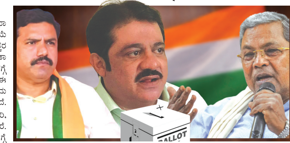
ಕಾಂಗ್ರೆಸ್‌ಗೆ ಬಿಜೆಪಿ ಹೈಪೋಟಿ ಅಂದು ಇಂದು ಬಿಜೆಪಿ ಭರ್ಜರೀಟಿಯಾಗಿರುವ ಬಾಗಲಕೋಟೆಯಲ್ಲಿ ಕಾಂಗ್ರೆಸ್ ಅನುಕಂಠ ಇದ್ದರೂ ಗೆಲುವು ಸುಲಭವಲ್ಲ ಎಂಬ ಕಾರಣಕ್ಕೆ ಖುದ್ದು ಸಿದ್ಧರಾದ ಮೈತ್ರಿ ಅಖಂಡ ಘಟಕ ಇಳಿದಿದ್ದಾರೆ. ಅಹಿಂಸೆ ಮತ್ತು ಒಗ್ಗೂಡಿಸುವುದು ರಣತಂತ್ರ ಈ ಹಿನ್ನೆಲೆಯಲ್ಲಿ ಸಿಎಂ ಪ್ರಚಾರ ನಡೆಸಿ ಮುಖಂಡರು, ಕಾರ್ಯಕರ್ತರಲ್ಲಿ ಹುಮ್ಮಸ್ಸು ತುಂಬಲಿದ್ದಾರೆ. ಗೆಲುವಿನ ಮೂಲಕ ತಿಷ್ಠನ ಋಣ ತೀರಿಸುವ ಇರಾವೆಯಲ್ಲಿದ್ದಾರೆ. ಆದರೆ ಮತದಾನದ ಅಂತರ್ಯ ಅರ್ಥವಾಗದಾಗಿದೆ.

• ಮಲ್ಲಮ್ಮ ನುಡಿ ವಾರ್ತೆ ಬೆಂಗಳೂರು ದಾವಣಗೆರೆ ದಕ್ಷಿಣ, ಬಾಗಲಕೋಟೆ ವಿಧಾನಸಭಾ ಕ್ಷೇತ್ರಗಳ ಉಪಚುನಾವಣೆ ಪ್ರಯುಕ್ತ ಮತದಾನದ ಪ್ರಕ್ರಿಯೆ ಮುಗಿಯುವವರೆಗೆ ಎಕ್ಸಿಟ್ ಪೋಲ್ (ಚುನಾವಣೋತ್ತರ ಸಮೀಕ್ಷೆ) ನಡೆಸಬಾರದು ಎಂದು ಭಾರತೀಯ ಚುನಾವಣಾ ಆಯೋಗವು ಕಟ್ಟುನಿಟ್ಟಾಗಿ ನಿಷೇಧಿಸಿದೆ. ಏಪ್ರಿಲ್ 9ರ ಬೆಳಿಗ್ಗೆ 7:00 ಗಂಟೆಯಿಂದ ಏ. 29ರ ಸಂಜೆ 6:30 ರವರೆಗೆ ಈ ನಿಷೇಧ ಜಾರಿಯಲ್ಲಿರುತ್ತದೆ. ಫಲಿತಾಂಶಗಳ ಪ್ರಕಟಿಸಬಾರದು ಎಂದು ರಾಜ್ಯ ಚುನಾವಣಾಧಿಕಾರಿ ಕಚೇರಿ ಸ್ಪಷ್ಟಪಡಿಸಿದೆ.