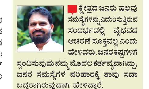
ಕ್ಷೇತ್ರದ ಜನರ ಹಲವು ಸಮಸ್ಯೆಗಳನ್ನು ಎದುರಿಸುತ್ತಿರುವ ಸಂದರ್ಭದಲ್ಲಿ ವೈಭವದ ಆಚರಣೆ ಸೂಕ್ತವಲ್ಲ ಎಂದು ಹೇಳಿದರು. ಜನರ ಕಷ್ಟಗಳಿಗೆ ಸ್ಪಂದಿಸುವುದು ನಮ್ಮ ಮೊದಲ ಕರ್ತವ್ಯವಾಗಿದ್ದು, ಜನರ ಸಮಸ್ಯೆಗಳ ಪರಿಹಾರಕ್ಕೆ ತಾವು ಸದಾ ಬದ್ಧರಾಗಿರುವುದಾಗಿ ಹೇಳಿದ್ದಾರೆ.