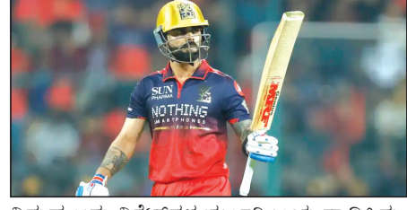
ವಿರುದ್ಧ ಆರು ವಿಕೆಟ್‌ಗಳ ಭರ್ಜರಿ ಜಯ ಸಾಧಿಸಿತು. ಅವರು ಹೇಳಿದಂತೆ ನಡೆದುಕೊಳ್ಳುತ್ತಾರೆ. ವಿರಾಟ್ ಕೊಟ್ಟ ಅತ್ಯುತ್ತಮ ಕ್ರಿಕೆಟ್ ಆಡುತ್ತಿದ್ದಾರೆ. ಆಟವನ್ನು ಪೂರ್ಣ ಪ್ರಯತ್ನ, ಕೌಶಲ್ಯ ಮತ್ತು ತೀವ್ರತೆಯಿಂದ ಹೇಗೆ ಆಡಬೇಕು ಎಂಬುದನ್ನು ತೋರಿಸುತ್ತಿದ್ದಾರೆ. ಇದು ಇತರರಿಗೆ ಮಾದರಿಯಾಗುವಂತೆ ಇತ್ತು. ಇದು ನನ್ನನ್ನು ಪ್ರಭಾವಿತಗೊಳಿಸಿತು" ಎಂದಿದ್ದಾರೆ ಅಶ್ವಿನ.