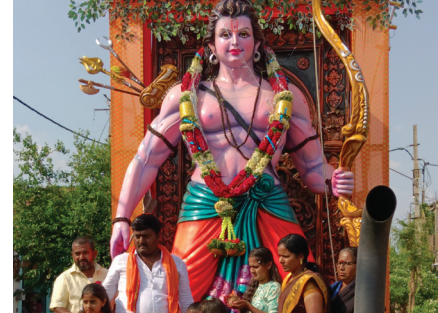
ಭಾಲ್ಕಿ ಪಟ್ಟಣದ ವಿಠಲ ಮಂದಿರದ ಹತ್ತಿರ ಶ್ರೀ ರಾಮನವಮಿ ಉತ್ಸವ ನಿಮಿತ್ತ ಶ್ರೀ ರಾಮನ ಮೂರ್ತಿಗೆ ಪೂಜೆ ಸಲ್ಲಿಸುವ ಮೂಲಕ ಶೋಭಾ ಯಾತ್ರೆಗೆ ಚಾಲನೆ ನೀಡಲಾಯಿತು.