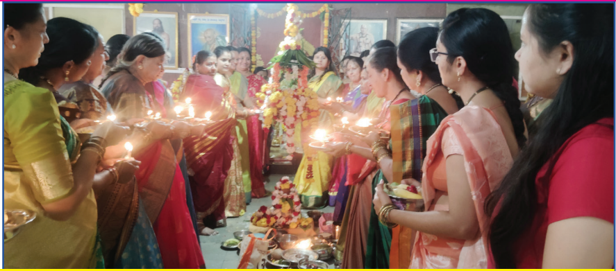
ಪಟ್ಟಣದ ದೇಸಾಯಿ ಓಟಿಯಲ್ಲಿರುವ ಸುಮಂಗಲಿಯಿಂದ ಜೋರಣ್ ಪದಗೇರಿಂದಿಗೆ ಶ್ರೀ ರಾಮನ ತೋಟಲೋತ್ಸವ ಕಾರ್ಯಕ್ರಮ ಜರುಗಿತು.