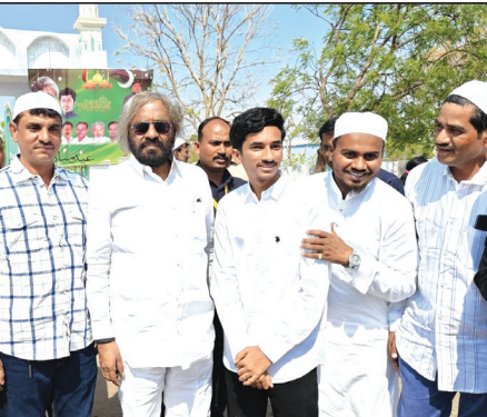
ನಾಡಿನ ಸಮಸ್ತ ಜನತೆಗೆ ರಂಜಾನ್ ಹಬ್ಬವು ಸುಖ, ಶಾಂತಿ ಮತ್ತು ಸಮೃದ್ಧಿಯನ್ನು ತರಲಿ ಎಂಬ ಹಾರೈಕೆ ವ್ಯಕ್ತಪಡಿಸಿದರು.

• ಮಲ್ಲಮ್ಮ ನುಡಿ ವಾರ್ತೆ ಭಾಲ್ಪಿ ಹಿಂದೂ-ಮುಸ್ಲಿಂ ಭಾವೈಕ್ಯತೆಯ ಸುಂದರ ಸಂದೇಶವನ್ನು ಸಾರುವ ಪವಿತ್ರ ರಂಜಾನ್ ಹಬ್ಬದ ಪ್ರಯುಕ್ತ, ಜಿಲ್ಲಾ ಉಸ್ತುವಾರಿ ಸಚಿವರಾದ ಶ್ರೀ ಈಶ್ವರ ಖಂಡ್ರೆ ಅವರು ಇಂದು ಭಾಲ್ಪಿಯ ಈದ್ಗಾ ಮೈದಾನಕ್ಕೆ ಭೇಟಿ ನೀಡಿ ಮುಸ್ಲಿಂ ಬಾಂಧವರನ್ನು ಆತ್ಮೀಯವಾಗಿ ಭೇಟಿ ಮಾಡಿ ಹಬ್ಬದ ಶುಭಾಶಯಗಳನ್ನು ಕೋರಿದರು. ಈ ಸಂದರ್ಭದಲ್ಲಿ ಮಾತನಾಡಿದ ಅವರು, ರಂಜಾನ್ ಹಬ್ಬವು ತ್ಯಾಗ, ಸಹಾನುಭೂತಿ ಮತ್ತು ಮಾನವೀಯತೆಯ ಮಹತ್ವವನ್ನು ಸಾರುತ್ತದೆ ಎಂದರು. ಇಂತಹ ಹಬ್ಬಗಳು ನಮ್ಮ ಸಮಾಜದಲ್ಲಿ ಏಕತೆ, ಸೌಹಾರ್ದ ಮತ್ತು ಸಹೋದರತ್ವವನ್ನು ಇನ್ನಷ್ಟು ಬಲಪಡಿಸುತ್ತವೆ ಎಂದು ತಿಳಿಸಿದರು.