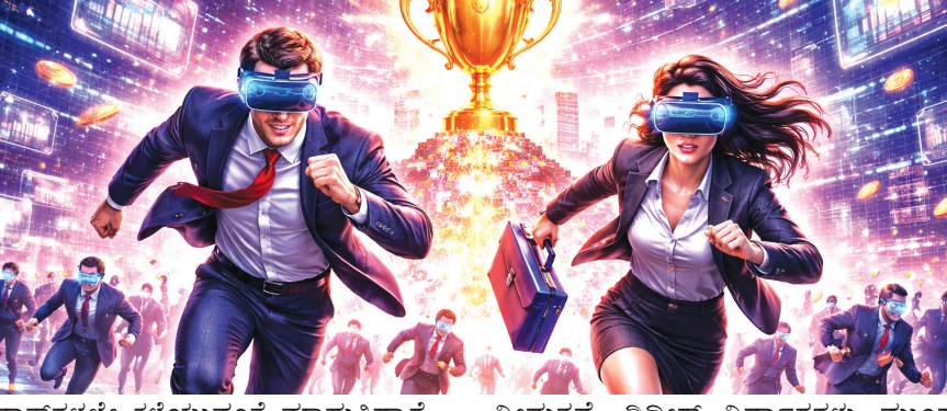
ಕ್ಲಾಸ್ಗಳಲ್ಲಿ ಕಳೆಯುವಂತೆ ಮಾಡುತ್ತಿದ್ದಾರೆ. ಇದರಿಂದಾಗಿ ಮಕ್ಕಳು ತಂದೆ-ತಾಯಿಯ ಜೊತೆಗೆ ಕಳೆಯುವ ಸಮಯ ಕಡಿಮೆಯಾಗಿದೆ. ಮಕ್ಕಳ ಮನಸ್ಸಿನ ಮೇಲೆ ಬೀರುವ ಒತ್ತಡವನ್ನು ಗಮನಿಸದೆ ಪ್ರೋತ್ಸಾಹಿಸುವ ನಡವಳಿ ಕೊಳ್ಳುತ್ತಿದ್ದಾರೆ. ಎಲ್ಲವನ್ನೂ 'ಫಾಸ್ಟ್' ಆಗಿ ಕಲಿತು, ಒಮ್ಮೆಲೇ ಅತಿಬುದ್ಧಿವಂತರಾಗಬೇಕು ಎನ್ನುವ ಹವಾಪಟು ಬಹಳ ಮಂದಿಯಲ್ಲಿ ತುರುವಾಗಿದೆ. ಮಕ್ಕಳು ಚಿಕ್ಕವರಿದ್ದಾಗ ನಾವು ಏನು ಹೇಳುತ್ತೇವೋ ಹಾಗೆಯೇ ಕಲಿಯುತ್ತಾರೆ, ಹಾಗಾಗಿ ಮಕ್ಕಳ ಭವಿಷ್ಯದ ನಿರ್ಧಾರಗಳನ್ನು ನಾವೇ ಮಾಡಬೇಕು ಎಂಬುದು ನಿಜವಾದರೂ, ಅವರು ಇಷ್ಟಪಟ್ಟು ಮಾಡುವ ಚಟುವಟಿಕೆಗಳತ್ತ ಗಮನಹರಿಸುವುದು ಅತಿ ಮುಖ್ಯ.

ಆಸಕ್ತಿಗಳು ಹಲವಾರಾದರೂ ಸಾಧನೆಗೆ ಗುರಿ ಒಂದೇ ಇರಲಿ ಸ್ಪರ್ಧಾತ್ಮಕ ಜಗತ್ತಿನಲ್ಲಿ ಮಕ್ಕಳನ್ನು ಓದಿದ ಪ್ರೋತ್ಸಾಹಿಸುವುದು ಹಲವಾರಾದರೂ ಸಾಧನೆಗೆ ಗುರಿ ಒಂದೇ ಇರಲಿ. ಮಕ್ಕಳ ಸಹಜ ಆಸಕ್ತಿಗಳನ್ನು ಮರೆಯುತ್ತಿದ್ದಾರೆಯೇ? ಸಾಧನೆಯ ಹಾದಿಯಲ್ಲಿ ಗುರಿ ಸ್ಪಷ್ಟವಾಗಿರಬೇಕು ನಿಜ, ಆದರೆ ಆ ಆಯ್ಕೆ ಹೇಗೆರಬೇಕು? ಶಿಕ್ಷಣ ಮತ್ತು ವೃತ್ತಿಬದುಕಿನ ನಿರ್ಧಾರಗಳ ಕುರಿತು ಒಂದು ವಿಶ್ಲೇಷಣಾತ್ಮಕ ನೋಟ ಇಲ್ಲಿದೆ. ಇಂದಿನ ಮೊಬೈಲ್ ಯುಗದಲ್ಲಿ ಕಂಡದ್ದನ್ನೆಲ್ಲ ನಾವೂ ಮಾಡೋಣ ಎನ್ನುವ ಮನಸ್ಸಿನಿಂದ ಮಾಡಿದ. ಬದುಕು 'ರಿಯಲ್' ಆಗಿರುವುದಕ್ಕಿಂತ ಹೆಚ್ಚಾಗಿ 'ವಿರ್ಚುವಲ್' ಮಾಯೆಯಾಗಿದೆ. ಮಕ್ಕಳ ಮನಸ್ಸನ್ನು ಅರ್ಥಮಾಡಿಕೊಳ್ಳುವ ಪ್ರೋತ್ಸಾಹ, ಅವರು ಆಟವಾಡುವ ವಯಸ್ಸಿನಲ್ಲಿ ಸ್ವಲ್ಪವೂ ಬಿಡುವಿಲ್ಲದಂತೆ ಮಕ್ಕಳನ್ನು ಬುಸ್ಸಿ ಮಾಡುತ್ತಿದ್ದಾರೆ. ಮಕ್ಕಳ ತುಂಟಾಟ, ತಲೆ-ಚೀಷ್ಣಗಳನ್ನು ಸಹಿಸದ ಎಷ್ಟೋ ತಾಯಂದಿರು ನಾನಾ ಟ್ಯೂಷನ್ ಕ್ಲಾಸ್ಗಳಿಗೆ ಸೇರಿಸುತ್ತಿದ್ದಾರೆ. ಅವರ ಇಷ್ಟ-ಕಷ್ಟಗಳ ಗೋಚರಿತ ಹೋಗದೆ, ತಮ್ಮ ರಿಲ್ಯಾಕ್ಸೇಶನ್ ಗಾಗಿ ಮಕ್ಕಳಿಗೆ ಬೇಕೋ ಬೇಡವೋ, ಆಸಕ್ತಿ ಇದೆಯೋ ಇಲ್ಲವೋ ಎಂಬುದನ್ನು ಗಮನಿಸದೆ ಟಿವಿ ಶೋಗಳು, ಕರಾಟೆ, ಸಂಗೀತ, ಚಿತ್ರಕಲೆ ಹೀಗೆ ನಾನಾ ತರಗತಿಗಳಿಗೆ ಸೇರಿಸಿ ವಾರಪೂರ್ತಿ ಮಕ್ಕಳು