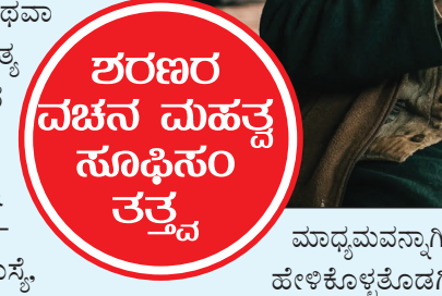
ಶರಣ ವಚನ ಮಹತ್ವ ಸೂಫಿಸಂ ತತ್ವ