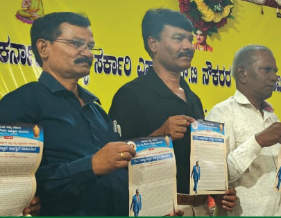
ಕೂಡಲೇ ಭರ್ತಿ ಆಗಬೇಕು. ಪಾಲಿ ಇರುವ ಸರ್ಕಾರಿ ಹುದ್ದೆಗಳನ್ನು ವೇಗವಾಗಿ ಭರ್ತಿ ಮಾಡಬೇಕು ಎಂದು ಸರ್ಕಾರಕ್ಕೆ ಮನವಿ ಮಾಡಿದರು. ಜನರಲ್ಲಿ ದೇಶಭಕ್ತಿ ಬರಬೇಕು. ಇದು ಅಂಬೇಡ್ಕರ್ ಅವರು ಪ್ರೀತಿಯ ಭಾರತವಾಗಬೇಕೆಂದು. ಮುಂದಿನ ಪೀಳಿಗೆಗೆ ಸಂವಿಧಾನ ಉಳಿಸಿ ಎನ್ನುವ ಜಾಗೃತಿ