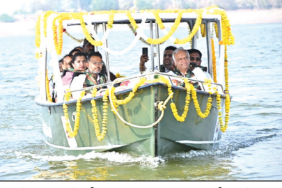
ಕರ್ನಾಟಕ, ತೆಲಂಗಾಣ, ಆಂಧ್ರ ಪ್ರದೇಶಗಳಿಂದ ಸಾವಿರಾರು ಪ್ರವಾಸಿಗರನ್ನು ಆಕರ್ಷಿಸುವ ಈ ಪ್ರದೇಶವು ಪರಿಸರ ಪ್ರವಾಸೋದ್ಯಮಕ್ಕೆ ಕೊಡುಗೆ ನೀಡುವ ಸಾಮರ್ಥ್ಯ ಹೊಂದಿದೆ. ಪ್ರವಾಸೋದ್ಯಮವನ್ನು ಉತ್ತೇಜಿಸುವ ಮೂಲಕ ಸ್ಥಳೀಯ ಆರ್ಥಿಕತೆಗೆ ಬಲ ತುಂಬುವ ನಿಟ್ಟಿನಲ್ಲಿ ನಮ್ಮ ಸರ್ಕಾರವು ಹಲವು ಕ್ರಿಯಾಶೀಲ ಯೋಜನೆಯನ್ನು ರೂಪಿಸಿದೆ. ಕಳೆದ ವರ್ಷ ರೂಪಿಸಿದ್ದ ನೇಶೇರ್ ಟ್ರಿಕ್ ಕಾರ್ಯಕ್ರಮದಲ್ಲಿ ಯಶಸ್ವಿಯಾಗಿ ಸಾವಿರಾರು ಜನರು ಚಾರಣ ಮಾಡಿದ್ದು ಖುಷಿಯ ವಿಚಾರ ಎಂದರು.

• ಮಲ್ಲಮ್ಮ ನುಡಿ ವಾರ್ತೆ ಕಲಬುರಗಿ ಜಿಲ್ಲೆಯ ಚಿಂಚೋಳಿ ಅರಣ್ಯಧಾಮದ ವಿವಿಧ ಪ್ರವಾಸೋದ್ಯಮ ಉತ್ತೇಜನ ಕಾರ್ಯಕ್ರಮಗಳನ್ನು ಗ್ರಾಮೀಣಾಭಿವೃದ್ಧಿ ಮತ್ತು ಪಂಚಾಯತ್ ರಾಜ್ ಹಾಗೂ ಐಟಿಬಿಟಿ ಸಚಿವ ಪ್ರಿಯಾಂಕ್ ಖರ್ಗೆ ಉದ್ಘಾಟಿಸಿದರು. ಚಿಂಚೋಳಿ ವನ್ಯಜೀವಿ ಅಭಯಾರಣ್ಯ ಕಲ್ಯಾಣ ಕರ್ನಾಟಕಕ್ಕೆ ಬಿಸಿನಾಡೆಂದೂ ತಂದೆರೆವ ಧಾಮ ಎನಿಸಿಕೊಳ್ಳುತ್ತದೆ. ಪರಿಸರ ಸಮತೋಲನವನ್ನು ಕಾಪಾಡುವಲ್ಲಿ ಪ್ರಮುಖ ಪಾತ್ರವಹಿಸುವ ಚಿಂಚೋಳಿ ಅಭಯಾರಣ್ಯ ವಿಶಿಷ್ಟ ನೈಸರ್ಗಿಕ ಸಂಪತ್ತನ್ನು ಹೊಂದಿದೆ. ಚಿರತೆಗಳು, ಕಾಡು ನಾಯಿಗಳು, ನೀಲಗಾಯ್, ಚುಕ್ಕೆ ಜಿಂಕೆಗಳು, ಬ್ಯಾಕ್ ಬಕ್ ಇತ್ಯಾದಿ ಪ್ರಾಣಿಗಳು ಇಲ್ಲಿನ ನಿಸರ್ಗದ ವಾರಸುದಾರರು. ಚಂದ್ರಂಪಳ್ಳಿ ಅಣೆಕಟ್ಟು, ಮಾರಿಕೊಪ್ಪುರ ಜಲಪಾತ ಮತ್ತು ಅನೇಕ ಸುಂದರವಾದ ಸ್ಥಳಗಳು ಈ ಪ್ರದೇಶದ ರಮಣೀಯತೆಯನ್ನು ಹೆಚ್ಚಿಸುತ್ತವೆ ಎಂದರು. ಕರ್ನಾಟಕ, ತೆಲಂಗಾಣ, ಆಂಧ್ರ ಪ್ರದೇಶಗಳಿಂದ ಸಾವಿರಾರು ಪ್ರವಾಸಿಗರನ್ನು ಆಕರ್ಷಿಸುವ ಈ ಪ್ರದೇಶವು ಪರಿಸರ ಪ್ರವಾಸೋದ್ಯಮಕ್ಕೆ ಕೊಡುಗೆ ನೀಡುವ ಸಾಮರ್ಥ್ಯ ಹೊಂದಿದೆ. ಪ್ರವಾಸೋದ್ಯಮವನ್ನು ಉತ್ತೇಜಿಸುವ ಮೂಲಕ ಸ್ಥಳೀಯ ಆರ್ಥಿಕತೆಗೆ ಬಲ ತುಂಬುವ ನಿಟ್ಟಿನಲ್ಲಿ ನಮ್ಮ ಸರ್ಕಾರವು ಹಲವು ಕ್ರಿಯಾಶೀಲ ಯೋಜನೆಯನ್ನು ರೂಪಿಸಿದೆ. ಕಳೆದ ವರ್ಷ ರೂಪಿಸಿದ್ದ ನೇಶೇರ್ ಟ್ರಿಕ್ ಕಾರ್ಯಕ್ರಮದಲ್ಲಿ ಯಶಸ್ವಿಯಾಗಿ ಸಾವಿರಾರು ಜನರು ಚಾರಣ ಮಾಡಿದ್ದು ಖುಷಿಯ ವಿಚಾರ ಎಂದರು.