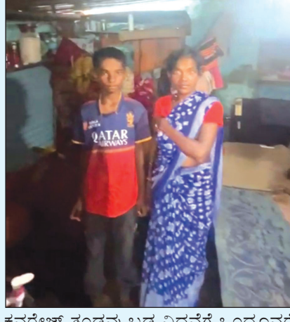
ಕವರೇಜ್ ತಂಡವು ಬಡ ವಿಧವೆಗೆ ಒಂದೂವರೆ ಲಕ್ಷ ರೂ. ಖರ್ಚು ಮಾಡಿ ಕಚ್ಚಾ ಮನೆಯನ್ನು ನಿರ್ಮಿಸಿ ಹಸ್ತಾಂತರಿಸಿದೆ.

ಬಡ ವಿಧವೆಯ ಕಷ್ಟ ನೋಡಲಾಗದೇ ಈ ಶಹಾಪೇಟೆಯ ತಂಡ ಬಿಜಾಪುರ ಯೂತ್