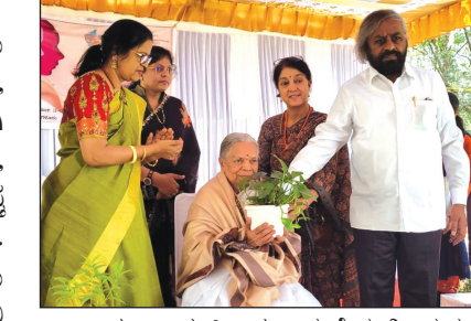
ತಾಯಿಯ ಪಾತ್ರ ಹಿರಿಯ: ಮನೆಯಲ್ಲಿ ಮಕ್ಕಳಿಗೆ ತಾಯಿಯಾಗಿ, ಸೋದರಿಯಾಗಿ, ಪತಿಗೆ ಮಡದಿಯಾಗಿ ಶ್ರಮಿಸುವ ಮಹಿಳೆ ಕಚೇರಿಯಲ್ಲೂ ಕಾರ್ಯ ನಿರ್ವಹಿಸುವ ಮೂಲಕ, ಸಂಸಾರದ ರಥ ಏಳಿಯುತ್ತಾರೆ, ಮಹಿಳೆಯರಿಗೆ ತಾಳ್ಮೆ ಹೆಚ್ಚು. ಅದಕ್ಕೇ ಕ್ಷಮೆಯಾಧರಿತರೇ ಎನ್ನುವುದು. ತಾಯಿಯಾಗಿ ನೀವೆಲ್ಲರೂ ಮಕ್ಕಳನ್ನು ಸತ್ಪೋಷಣೆ ಮಾಡಿ, ಕೆಲಸದಲ್ಲಿ ಶ್ರದ್ಧೆ, ಪ್ರಾಮಾಣಿಕತೆಯಿಂದ ರಾಜ್ಯದ ಮತ್ತು ಆ ಮೂಲಕ ದೇಶದ ಅಭಿವೃದ್ಧಿಗೆ ಶ್ರಮಿಸಿ ಎಂದರು.