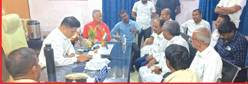
ರಸ್ತೆ ಬದಿ ಬೀದಿಯಲ್ಲಿ ಸಾರ್ವಜನಿಕವಾಗಿ ಮೂತ್ರ ವಿಸರ್ಜನೆ ಮಾಡುವುದನ್ನು ಪ್ರಶ್ನಿಸಿದ ಹಿರಿಯ ನ್ಯಾಯವಾದಿಗಳ ಮೇಲೆ ಹಾಗೂ ಅವರ ಪತ್ನಿಯ ಮೇಲೆ ಯುವಕನೊಬ್ಬ ಹಲ್ಲೆ ಮಾಡಿರುವ ಘಟನೆ ಕೊಪ್ಪಳ ಜಿಲ್ಲೆಯ ಗಂಗಾವತಿಯಲ್ಲಿ ನಡೆದಿದೆ. ಈ ಘಟನೆಯನ್ನು ಖಂಡಿಸಿ ಮಂಗಳವಾರ ರಾತ್ರಿ ನೂರಾರು ಸಂಖ್ಯೆಯ ವಕೀಲರು ಹಾಗೂ ಸಾರ್ವಜನಿಕರು ನಗರ ಪೊಲೀಸ್ ಠಾಣೆಗೆ ಮುತ್ತಿಗೆ

ಹಾಗೂ ಅನೇಕರು ಗಂಗಾವತಿ ಹಿರಿಯ ವಕೀಲರ ಮೇಲೆ ಹಲ್ಲೆ ಆರೋಪಿ ಬಂಧನಕ್ಕೆ ಆಗ್ರಹಿಸಿ ಪೊಲೀಸ್ ಠಾಣೆಗೆ ಮುತ್ತಿಗೆ