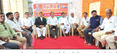
ಅಂದು ಭಾನುವಾರ ಇದ್ದರೂ ಸಹ ತಾಲೂಕು ಮಟ್ಟದ ಅಧಿಕಾರಿಗಳ ಮೇಲೆ ಒತ್ತಡ ಹೇರಿ ಎಲ್ಲಾ ಸಿಬ್ಬಂದಿಗಳು ಭಾಗವಹಿಸಬೇಕೆಂದು ಹೇಳಿ ವಾಮಮಾರ್ಗದಿಂದ ಜನರನ್ನು ಸೇರಿಸಿದ್ದಾರೆ.

ಬಿಜೆಪಿ ಕಚೇರಿಯಲ್ಲಿ ಮಂಗಳವಾರ ನಡೆದ ಸುದ್ದಿಗೋಷ್ಠಿಯಲ್ಲಿ ಮಾತನಾಡಿದ ಅವರು, ಮಲ್ಲಿಕಾರ್ಜುನ ಖರ್ಗೆ ಅವರೇ ಗುಲಾಮರಾಗಿದ್ದು ಮೋದಿ ಟ್ರಂಪ್ ಗುಲಾಮರೆಂದು ಹೇಳಿರುವುದಕ್ಕೆ ಸಂವಿಧಾನದ ಪ್ರಮುಖವಾದ ಪ್ರಧಾನಮಂತ್ರಿ ಮಧ್ಯೆಗೆ ಅಗೌರವವಾಗಿ ಏಕ ವಚನದಲ್ಲಿ ಮಾತನಾಡುವುದು ಖರ್ಗೆ ಅವರಿಗೆ ಶೋಭೆ ತರುವುದಿಲ್ಲ ಉಗ್ರವಾಗಿ ಖಂಡಿಸಲಾಗುವುದು ಎಂದು ಹೇಳಿದರು.