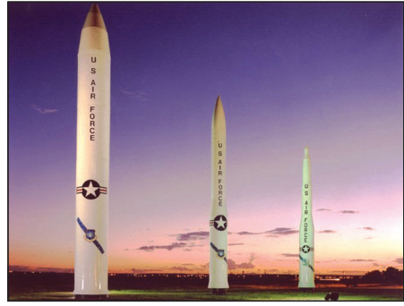
ವಾಯುಪಡೆಯ ಗ್ಲೋಬಲ್ ಸ್ಟ್ರೈಕ್ ಕಮಾಂಡ್ ವ್ಯಾಂಡೆನ್‌ಬರ್ಗ್ ಬಾಹ್ಯಾಕಾಶ ಪಡೆ ನೆಲೆಯಿಂದ ನಿರಾಯುಧ ಮಿನಿಟ್ಮನ್ ಅನು ಉದಾವಣೆ ಮಾಡಿದೆ ಎಂದು ಯುಎಸ್ ಬಾಹ್ಯಾಕಾಶ ಪಡೆ ಹೇಳಿದೆ.

• ಮಲ್ಲಮ್ಮ ನುಡಿ ವಾರ್ತೆ ವಾಷಿಂಗ್ಟನ್ ಅಮೆರಿಕಾ-ಇರಾನ್ ಮಧ್ಯ ಯುದ್ಧ ತಾರಕಕ್ಕೇರಿದೆ. ಯುದ್ಧದ ಕಾವು ಹೆಚ್ಚುತ್ತಿದ್ದಂತೆ ಅಮೆರಿಕಾ ಕ್ಯಾಲಿಫೋರ್ನಿಯಾದ ಕರಾವಳಿಯಲ್ಲಿ ಅತ್ಯಂತ ಅಪಾಯಕಾರಿ ಪರಮಾಣು ಸಾಮರ್ಥ್ಯದ ಮಿನಿಟ್ಮನ್ III ಖಂಡಾಂತರ ಬ್ಯಾಲಿಸ್ಟಿಕ್ ಕ್ಷಿಪಣಿಯನ್ನು ಪರೀಕ್ಷಿಸಿದೆ. ಈ ಪರಮಾಣು ಸಾಮರ್ಥ್ಯದ ಮಿನಿಟ್ಮನ್ ಖಂಡಾಂತರ ಬ್ಯಾಲಿಸ್ಟಿಕ್ ಕ್ಷಿಪಣಿ ಜಪಾನ್ ಹಿರೋಷಿಮಾ ಮೇಲೆ ಪ್ರಯೋಗ ಮಾಡಿದ ಪರಮಾಣು ಬಾಂಬ್‌ಗಳಿಗಿಂತ 20 ಪಟ್ಟು ಹೆಚ್ಚು ಶಕ್ತಿಶಾಲಿಯಾಗಿದೆ. ವಾಕ್ ಹೆಡ್‌ಗಳನ್ನು ಹೊತ್ತೊಯ್ಯುವ ಸಾಮರ್ಥ್ಯವನ್ನು ಹೊಂದಿದೆ. ಮಧ್ಯಪ್ರಾಚ್ಯದಲ್ಲಿ ಉದ್ದಿಗತ ಹೆಚ್ಚಾಗುತ್ತಿರುವ ಬೆನ್ನಲೆ, ಇದರ ಪರಿಣಾಮ ಅಮೆರಿಕ ಮುಂದಾಗಿದ್ದು,