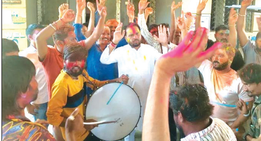
ಯುವಕರು, ಮಾಜಿ ಸಚಿವರ ಜತೆಗೂಡಿ ತಮಟೆ ವಾದ್ಯಗಳಿಗೆ ಕುಣಿದು ಕುಪ್ಪಳಿಸಿದರು.