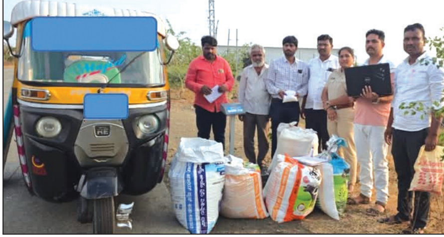
ಮಲ್ಲಮ್ಮ ನುಡಿ ವಾರ್ತೆ ಕಮಲನಗರ