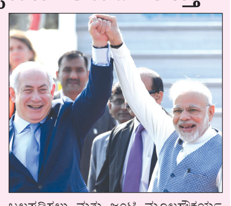
ಬಲಪಡಿಸಲು ಮತ್ತು ಜಂಟಿ ಮೂಲಸೌಕರ್ಯ ಅಭಿವೃದ್ಧಿಯನ್ನು ಉತ್ತೇಜಿಸಲು ಬದ್ಧರಾಗಿದ್ದಾರೆ ಎಂದು ಪ್ರಧಾನಿ ಮೋದಿ ಹೇಳಿದ್ದಾರೆ.

• ಮಲ್ಲಮ್ಮ ನುಡಿ ವಾರ್ತೆ ಟೆಲ್ ಅವೀವ್ ಪ್ರಧಾನಿ ನರೇಂದ್ರ ಮೋದಿ ಅವರು ಇಸ್ರೇಲ್ ಜೊತೆ ರಕ್ಷಣಾ ಒಪ್ಪಂದಕ್ಕೆ ಮುನ್ನುಡಿ ಬರೆದಿದ್ದಾರೆ. ಜೊತೆಗೆ ವ್ಯಾಪಾರ ಹಾಗೂ ಭಯೋತ್ಪಾದನಾ ನಿಗ್ರಹ ಸಂಬಂಧಗಳನ್ನು ಬಲಪಡಿಸುವುದಾಗಿ ಘೋಷಿಸಿದ್ದಾರೆ. ಈ ಒಪ್ಪಂದ ಉಭಯ ರಾಷ್ಟ್ರಗಳ ನಡುವಿನ ರಕ್ಷಣಾ ಸಂಬಂಧಗಳು ಪಾಲುದಾರಿಕೆಯ ಪ್ರಮುಖ ಆಧಾರಸ್ತಂಭ ಎಂದು ಪ್ರಧಾನಿ ಮೋದಿ ಅವರು ಒಂಬತ್ತು ವರ್ಷಗಳಲ್ಲಿ ಮೊದಲ ಬಾರಿಗೆ ಟೆಲ್ ಅವೀವ್‌ಗೆ ಆಗಮಿಸಿದ ಬಳಿಕ ಅವರು ಇಸ್ರೇಲ್ ಸಂಸತ್ತಿನ ನೆಸೆಟ್‌ನಲ್ಲಿ ಮಾಡಿದ ಭಾಷಣದಲ್ಲಿ ಈ ವಿಷಯ ತಿಳಿಸಿದ್ದಾರೆ. ಬೆಂಜಮಿನ್ ನೆತನ್ಯಾಹು ವ್ಯಾಪಾರವನ್ನು ವಿಸ್ತರಿಸಲು, ಹೂಡಿಕೆ ಹರವನ್ನು