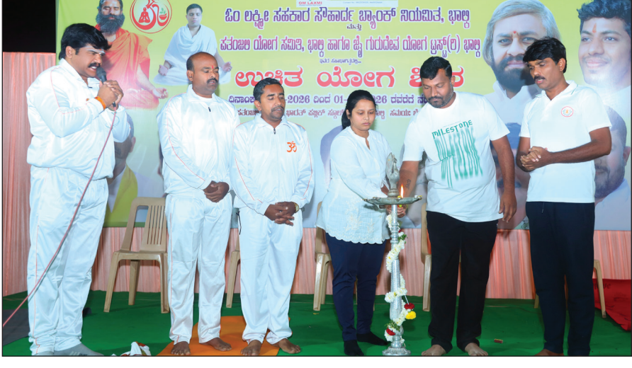
ಮಲ್ಲಮ್ಮ ನುಡಿ ವಾರ್ತೆ ಭಾಲ್ಕಿ