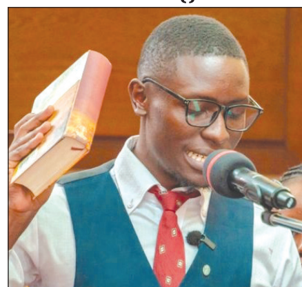
ಹುಟ್ಟಿಕೊಂಡಿರುವುದು, ಅದೇ ಸತ್ಯ, ಹಾಗೂ ಇದು ಉದ್ದೇಶ ಪೂರ್ವಕ ನಡೆ ಎಂದಿದ್ದಾರೆ.