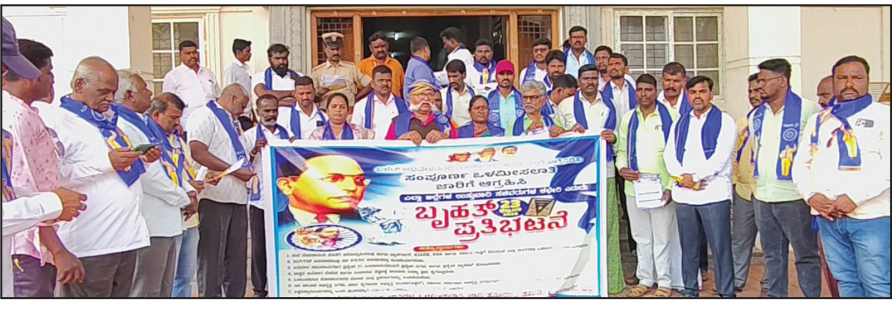
ವಿಜಯನಗರ(ಹೊಸಪೇಟೆ)