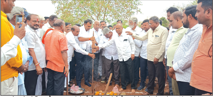
ಮಲ್ಲಮ್ಮ ನುಡಿ ವಾರ್ತೆ ಚಟುಗುಪ್ಪ