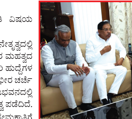
ಮುಖ್ಯಮಂತ್ರಿ ಸಿದ್ದರಾಮಯ್ಯ ನೇತೃತ್ವದಲ್ಲಿ ಸಚಿವರ ಮಹತ್ವದ ಸಭೆ ನಡೆಯಿತು.

• ಮಲ್ಲಮ್ಮ ನುಡಿ ವಾರ್ತೆ ಬೆಂಗಳೂರು ರಾಜ್ಯ ಕಾಂಗ್ರೆಸ್ ಸರ್ಕಾರಕ್ಕೆ ಒಳ ಮೀಸಲಾತಿ ವಿಷಯ ತಳಮತಳ ಉಂಟುಮಾಡಿದೆ. ಈ ಕುರಿತು ಮುಖ್ಯಮಂತ್ರಿ ಸಿದ್ದರಾಮಯ್ಯ ನೇತೃತ್ವದಲ್ಲಿ ಪರಿಶಿಷ್ಟ ಜಾತಿ ಮತ್ತು ಪರಿಶಿಷ್ಟ ಪಂಗಡದ ಸಚಿವರ ಮಹತ್ವದ ಸಭೆ ನಡೆಯಿತು. ರಾಜ್ಯದಲ್ಲಿ ಬಾಕಿ ಇರುವ ಸರ್ಕಾರಿ ಹುದ್ದೆಗಳ ಭರ್ತಿ ಹಾಗೂ ಒಳಮೀಸಲಾತಿ ಜಾರಿ ಕುರಿತು ಗಂಭೀರ ಚರ್ಚೆ ನಡೆಸಲಾಯಿತು. ಒಳಮೀಸಲು ವಿಧೇಯಕಕ್ಕೆ ರಾಜಭವನದಲ್ಲಿ ತಡೆ ಉಂಟಾಗಿರುವ ಹಿನ್ನೆಲೆಯಲ್ಲಿ ಈ ಸಭೆ ಮಹತ್ವ ಪಡೆದಿದೆ.