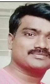
ಬಾರಿ ಅಪಘಾತ, ತುರ್ತು ಪರಿಸ್ಥಿತಿಗಳಲ್ಲಿ ಸಾರ್ವಜನಿಕ ನೆರವಿಗೆ ನಿಂತು ಸಾವಿರಾರು ಜನರ ರಕ್ಷಣೆಯನ್ನು ನೀಡಿದ್ದಾರೆ. ಸಾರ್ವಜನಿಕ ನೆರವಿಗೆ ನಿಂತು ಸಾವಿರಾರು ಜನರ ರಕ್ಷಣೆ ಮಾಡುತ್ತಾ ಸಚಿವರನ್ನು ಗೌರವಿಸುವುದು ನಾಗರಿಕರ ಕರ್ತವ್ಯವಾಗಿದೆ ಎಂದರು. ಕರ್ನಾಟಕ