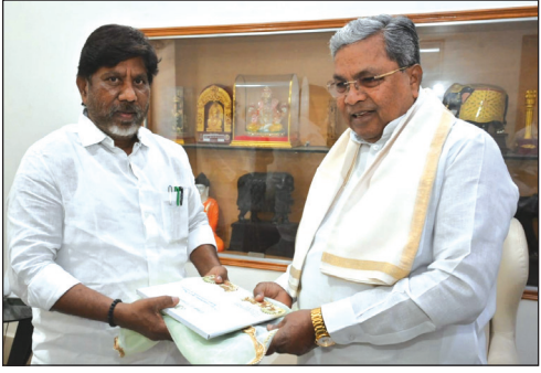
ತಲಂಗಾಣ ರಾಜ್ಯದ ಉಪಮುಖ್ಯಮಂತ್ರಿ ಬಟ್ಟಿ ವಿಕ್ರಮಾರ್ಕ ಅವರು ಇಂದು ಮುಖ್ಯಮಂತ್ರಿ ಸಿದ್ದರಾಮಯ್ಯ ಅವರನ್ನು ಕಾವೇರಿಯಲ್ಲಿ ಭೇಟಿಯಾದರು.

Mallammanudi Regional News Paper ಪ್ರಾದೇಶಿಕ ಕನ್ನಡ ದೈನಿಕ