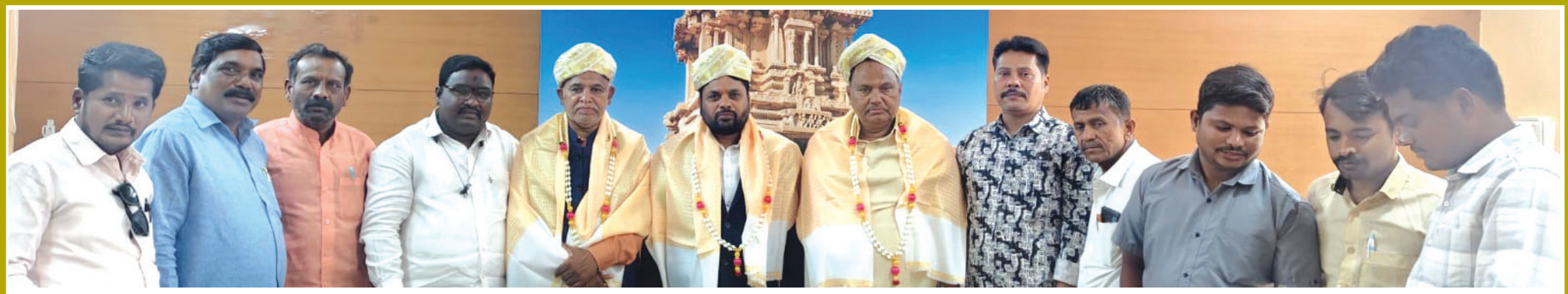
ಬಳ್ಳಾರಿ, ಕೊಪ್ಪಳ ಹಾಗೂ ವಿಜಯನಗರ ಜಿಲ್ಲಾ ಬ್ಯಾರೋಗಳ ಮುಖ್ಯಸ್ಥರ ಜೊತೆ ನಡೆದ ಸಭೆಯಲ್ಲಿ ಹಾಲ್ಕೊಂಡ ಮಲ್ಲಮ್ಮನುಡಿ ಪತ್ರಿಕಾ ಬಳಕೆ.