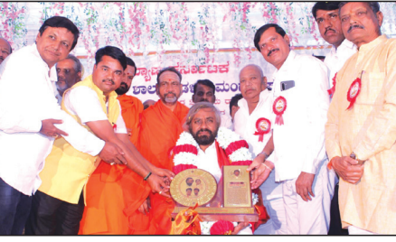
ಶಿಕ್ಷಣದ ಉತ್ತೇಜನಕ್ಕೆ ಮಹಾಸಭೆಯ ಮೂಲಕ ಮತ್ತಷ್ಟು ಪರಿಣಾಮಕಾರಿ ಕಾರ್ಯೋಜನೆಗಳನ್ನು ರೂಪಿಸಲಾಗುವುದು ಎಂದು ತಿಳಿಸಿದರು. ಈ ಸಂದರ್ಭದಲ್ಲಿ ಸಂಘದ ಪದಾಧಿಕಾರಿಗಳು, ಸಮಾಜದ ಮುಖಂಡರು ಹಾಗೂ ಗಣ್ಯರು ಉಪಸ್ಥಿತರಿದ್ದು, ಸಚಿವರಿಗೆ ಅಭಿನಂದನೆ ಸಲ್ಲಿಸಿದರು.