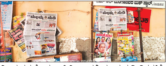
ವಿಜಯಪುರ ಕೇಂದ್ರ ಬಸ್ ನಿಲ್ದಾಣದಲ್ಲಿ ಮಲ್ಲಮ್ಮನುಡಿ ದಿನಪತ್ರಿಕೆ.