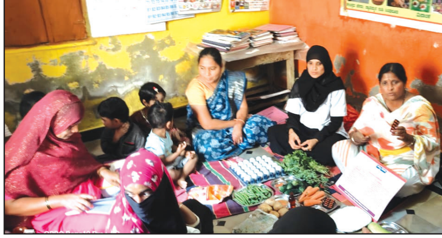
ಸೇವಿಸಬೇಕು ಅತಿ ಹೆಚ್ಚು ತರಕಾರಿ ಸೇವನೆ ಮಾಡಬೇಕು. ಹತ್ತಿರದ ಪ್ರಾಥಮಿಕ ಆರೋಗ್ಯ ಕೇಂದ್ರಕ್ಕೆ ಅಥವಾ ಆಸ್ಪತ್ರೆಗೆ ಭೇಟಿ ನೀಡಿ ಹಿಮೋಗ್ಲೋಬಿನ್ ಪರೀಕ್ಷೆ ಮಾಡಿಕೊಳ್ಳತಕ್ಕದ್ದು, ರಕ್ತಹೀನತೆಗೆ ಕಾರಣಗಳು ದಿನನಿತ್ಯ ಆಹಾರದಲ್ಲಿ ಸಾಕಷ್ಟು ಪ್ರಮಾಣದಲ್ಲಿ ರಕ್ತ ಉತ್ಪತ್ತಿಗೆ ಬೇಕಾದ ಕಬ್ಬಿಣ ಅಂಶ ಪೋಲಿಕ್ ಆಮ್ಲ, ವಿಟಮಿನ್ ಬಿ12 ಮುಂತಾದ ಪೋಷಕಾಂಶವಿರುವ ಆಹಾರ ಪದಾರ್ಥಗಳನ್ನು ಸೇವಿಸದ ಇರುವುದು ಜಂತುಹುಳು ಕೊಕ್ಕೆ ಹುಳು ಮುಂತಾದ ಸೋಂಕಿಗೆ ತುತ್ತಾಗುವುದು ಬಯಲಿನಲ್ಲಿ ಮಲವಿಸರ್ಜನೆ ಮಾಡುವುದು ಶೌಚಾಲಯ ಬಳಸದ ಇರುವುದು ಸಾಬೂನು ಮತ್ತು ನೀರಿನಿಂದ ಕೈ ಕಾಲುಗಳನ್ನು ತೊಳೆಯದ ಇರುವುದು ಪಾದರಕ್ಷೆಗಳನ್ನು ಬಳಸದ ಇರುವುದು ಹೊರಗಡೆ ಸುತ್ತಾಡುವುದು ಮಹಿಳೆಯರಲ್ಲಿ ಮುಟ್ಟಿನ ಬೆಳೆ ಅತಿಯಾದ

ಮಾತನಾಡಿದರು. ತಾಯಿ ಆರೋಗ್ಯವಂತ ಮಗು ಕುರಿತು ತಾಯಂದಿರ ಸಭೆಯಲ್ಲಿ ಎಲ್ಲಾ ವಯಸ್ಸಿನವರು ತಮ್ಮ ದಿನನಿತ್ಯದ ಆಹಾರ ಸೇವನೆಯಲ್ಲಿ ಕಬ್ಬಿಣಾಂಶದ ಕೊರತೆಯೇ ರಕ್ತಹೀನತೆಗೆ ಕಾರಣವಾಗುತ್ತದೆ ಎಂದು ಆಹಾರ ಪದಾರ್ಥಗಳನ್ನು ತಪ್ಪದೇ ತಿಳಿಸುವುದು ಗರ್ಭಿಣಿಯರು ಎರಡನೆಯ ತ್ರೈಮಾಸಿಕದಲ್ಲಿ ಜಂತುಹುಳು ನಿವಾರಕ ಮಾತ್ರೆಗಳನ್ನು ಸೇರಿಸಿ ಎಳ್ಳು ಬೆಲ್ಲ ಹಸಿರು ತರಕಾರಿ ಖರ್ಜೂರು, ಒಣ ದ್ರಾಕ್ಷಿ ಸೇವನೆ ಮಾಡುವುದು ತೊಂದರೆಗಳನ್ನು ತಡೆಗಟ್ಟಲು ಸಹಾಯ ಮಾಡುತ್ತದೆ ಕಬ್ಬಿಣಾಂಶದ ಮಾತ್ರೆಗಳ ಸೇವನೆ ಎಲ್ಲಾ ಗರ್ಭಿಣಿಯರ ಐದು ತಿಂಗಳ ಅವಧಿಯಿಂದ ಒಂದು (ಐರನ್ ಪೋಲಿಕ್ ಆಮ್ಲ) ಮಾತ್ರೆಯನ್ನು ಪ್ರತಿದಿನ ಒಂದರಂತೆ ತಪ್ಪದೆ