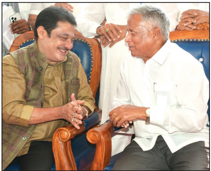
ಅಭಿವೃದ್ಧಿ ಕೆಲಸಗಳನ್ನು ಸೋಮಣ್ಣ ಮಾಡುವ ಹಾಗೆ ಯಾರು ಮಾಡೋಕೆ ಸಾಧ್ಯವಿಲ್ಲ ಎಂದು ಸೋಮಣ್ಣರನ್ನು ಕಂಡಾಡಿದ್ದಾರೆ.

• ಮಲ್ಲಮ್ಮ ನುಡಿ ವಾರ್ತೆ ಬೆಂಗಳೂರು ಬೆಂಗಳೂರಿನ ವಿಜಯನಗರ-ಮೈಸೂರು ರಸ್ತೆಯ ನಾಯಂಡಹಳ್ಳಿ ಬಳಿ ನೂತನ ರಸ್ತೆ ಮೇಲ್ವಿಚಾರಣೆಯನ್ನು ಕೇಂದ್ರ ರೈಲ್ವೆ ಖಾತೆ ರಾಜ್ಯ ಸಚಿವ ವಿ. ಸೋಮಣ್ಣ ಇಂದು ಲೋಕಾರ್ಪಣೆಗೊಳಿಸಿದ್ದಾರೆ. ಈ ರಸ್ತೆ ಮೇಲ್ವಿಚಾರಣೆ ಈ ಭಾಗದ ಜನರ ಬಹುದಿನದ ಬೇಡಿಕೆಯಾಗಿತ್ತು. ನೂತನ ಮೇಲ್ವಿಚಾರಣೆಯು ವಿಜಯನಗರ ಹಾಗೂ ಪಾದರಾಯನಪುರದ ಜನತೆಗೆ ಸಹಕಾರಿಯಾಗಲಿದೆ ಎಂದು ಸಚಿವ ಸೋಮಣ್ಣ ತಿಳಿಸಿದ್ದಾರೆ. ಇದೇ ವೇಳೆ ಮಾತನಾಡಿದ ರಾಜ್ಯ ವಸತಿ ಸಚಿವ ಜಮೀರ್ ಅಹ್ಮದ್ ಖಾನ್, ರಾಜ್ಯದಲ್ಲಿ ಕ್ಷೇತ್ರದ