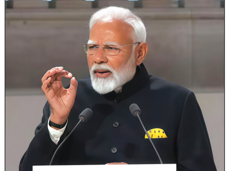
ಬುದ್ಧಿಮತ್ತೆಗೆ ಸಂಬಂಧಿಸಿದ ಪ್ರದರ್ಶನಗಳು ಹಾಗೂ ವಿಶ್ವದ ಅತ್ಯಂತ ವೇಗವಾಗಿ ಬೆಳೆಯುತ್ತಿರುವ ತಂತ್ರಜ್ಞಾನ-ಜಾಲಿತ ವಲಯದ ಇತರ ಬೆಳವಣಿಗೆಗಳ ಬಗ್ಗೆ ತಿಳಿದುಕೊಂಡಿದ್ದಾರೆ.