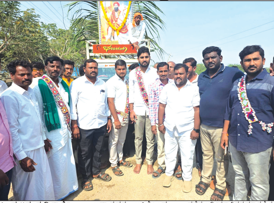
ಮಲ್ಲಮ್ಮ ನುಡಿ ವಾರ್ತೆ ಯಾದಗಿರಿ