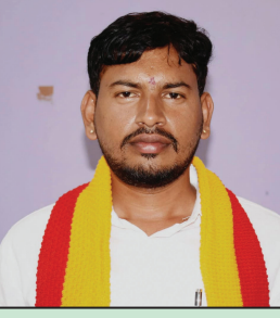
ಮಲ್ಲಮ್ಮ ನುಡಿ ವಾರ್ತೆ ಯಾದಗಿರಿ