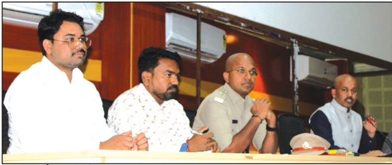
165 ಕಾಲೇಜುಗಳಲ್ಲಿ ಒಟ್ಟು 39 ಪರೀಕ್ಷಾ ಕೇಂದ್ರಗಳನ್ನು ಸ್ಥಾಪಿಸಲಾಗಿದೆ. ಪರೀಕ್ಷೆಯಲ್ಲಿ ಯಾವುದೇ ರೀತಿಯ ಅಕ್ರಮ ಚಟುವಟಿಕೆಗಳು ನಡೆಯದಂತೆ ಮುಂಜಾಗ್ರತಾ ಕ್ರಮವಹಿಸಿ ಪಾರದರ್ಶಕವಾಗಿ ಪರೀಕ್ಷೆ ನಡೆಸಲು ಅಗತ್ಯ

ಜಿಲ್ಲಾಡಳಿತ ಭವನದಲ್ಲಿರುವ ಅಡಿಹೋರಿಯಂ ಹಾಲ್‌ನಲ್ಲಿ ಸೋಮವಾರ ಜರುಗಿದ ದ್ವಿತೀಯ ಪಿಯುಸಿ ವಾರ್ಷಿಕ ಪರೀಕ್ಷೆ ಪೂರ್ವ ಸಿದ್ಧತಾ ಸಭೆಯ ಅಧ್ಯಕ್ಷತೆ ವಹಿಸಿ ಮಾತನಾಡಿದ ಅಪರ ಜಿಲ್ಲೆಯಲ್ಲಿ ಒಟ್ಟು 27009 ವಿದ್ಯಾರ್ಥಿಗಳು ಪರೀಕ್ಷೆ ಬರೆಯಲಿದ್ದು, ಅದಕ್ಕಾಗಿ ಜಿಲ್ಲೆಯಾದ್ಯಂತ