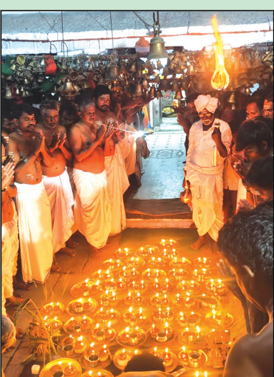
ಮಲ್ಲಮ್ಮ ನುಡಿ ವಾರ್ತೆ ಯಾದಗಿರಿ

ಮಹಾ ಶಿವರಾತ್ರಿ ನಿಮಿತ್ತ ತಾಲೂಕಿನ ಸುಕ್ಷೇತ್ರ ಹಯ್ಯಾಳ (ಬಿ) ಗ್ರಾಮದ ಶಿವ ಹಯ್ಯಾಳ ಲಿಂಗೇಶ್ವರ ದೇವಸ್ಥಾನದಲ್ಲಿ ಬೆಳಿಗ್ಗೆಯಿಂದಲೇ ವಿವಿಧ ಪೂಜಾ ಕಾರ್ಯಕ್ರಮಗಳು ಹಮ್ಮಿಕೊಳ್ಳಲಾಗಿತ್ತು. ಸಾಯಂಕಾಲ 8:00 ಯಿಂದ ಶಿವನಾಮದೊಂದಿಗೆ ವಿಶೇಷ ಪೂಜೆ ದೀಪಾರತಿ ಶಂಕೆ ಡೊಳ್ಳಿನ ವಾದ್ಯದೊಂದಿಗೆ ಅತ್ಯಂತ ಸಂಭ್ರಮದಿಂದ ಶಿವ ರಾತ್ರಿ ಜಾಗರಣೆ ಜರುಗಿತು. ಪ್ರತಿ ಶಿವರಾತ್ರಿಯಂದು ದೇವಸ್ಥಾನದಲ್ಲಿ ವಿವಿಧ ಬಗೆಯ ಸಿಹಿ ತಿನಿಸುಗಳನ್ನು ಬಜೆ ಕರದಂಟು ಕಡಲೆ ಗುಗ್ಗರಿ ಮಂಡಾಳು ಒಗ್ಗರಣೆ ತಯಾರಿಸಿ ಶಿವರಾತ್ರಿ ಅಂಗವಾಗಿ ಉಪವಾಸ ವ್ರತ ಮಾಡುವ ಭಕ್ತಿಗೆ ಪ್ರಸಾದ ರೂಪದಲ್ಲಿ ವಿತರಿಸುವ ವಾಡಿಕೆಯು ಹಿಂದಿನ ಕಾಲದಿಂದ ಬಂದಿದೆ ಎಂದು ದೇವಸ್ಥಾನದ ಪೂಜಾರಿಗಳು ತಿಳಿಸಿದರು. ಗ್ರಾಮದ ಮಹಿಳೆಯರು ಕೂಡಾ ಮನೆಯಲ್ಲಿ ವಿವಿಧ ಬಗೆಯ ಸಿಹಿ ತಿಂಡಿ ಹಣ್ಣು ಹಂಪಲುಗಳನ್ನು ತಂದು ದೇವಸ್ಥಾನಕ್ಕೆ ನೀಡುವ ವಿಶೇಷತೆ ಇದೆ ಭಕ್ತರು ನೀಡಿದಂತಹ ಎಲ್ಲಾ ಹಣ್ಣು ಹಂಪಲು ಸಿಹಿ ತಿಂಡಿಗಳನ್ನು ಬಂದಡೆ ಸಂಗ್ರಹಿಸಿ ಎಲ್ಲಾ ಭಕ್ತಿಗೆ ಸಾಮೂಹಿಕವಾಗಿ ವಿತರಿಸಿದರು. ವಿವಿಧ ಭಾಗಗಳಿಂದ ಸಹ್ಯಾರು ಭಕ್ತರು ಆಗಮಿಸಿ ಶ್ರೀ ಹಯ್ಯಾಳ ಲಿಂಗೇಶ್ವರ ದರ್ಶನ ಪಡೆದರು ಜಾಗರಣೆ ನಿಮಿತ್ತ ದೇವಸ್ಥಾನದಲ್ಲಿ ರಾತ್ರಿ ಇಡಿ ಭಜನಾ ಡೊಳ್ಳಿನ ಕಾರ್ಯಕ್ರಮ ನಡೆಯಿತು.