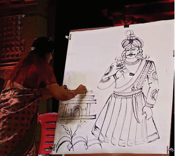
ಇದ್ದರು. ವೇದಿಕೆಯಲ್ಲಿ ಭಾಗವಹಿಸಿದ್ದ ಕಲಾಕಂಡಗಳಿಗೂ ಪ್ರಮಾಣಪತ್ರ, ಸ್ಮರಣಿಕೆ ನೀಡಿ ಗೌರವಿಸಲಾಯಿತು.