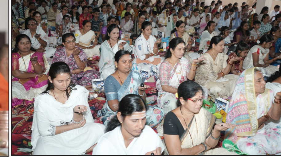
ಸಾಮೂಹಿಕ ಇಷ್ಟಲಿಂಗ ಪೂಜೆಯಲ್ಲಿ ಸಾವಿರಾರು ಸಂಖ್ಯೆಯಲ್ಲಿ ಭಕ್ತರು ಭಾಗವಹಿಸಿದ್ದರು.