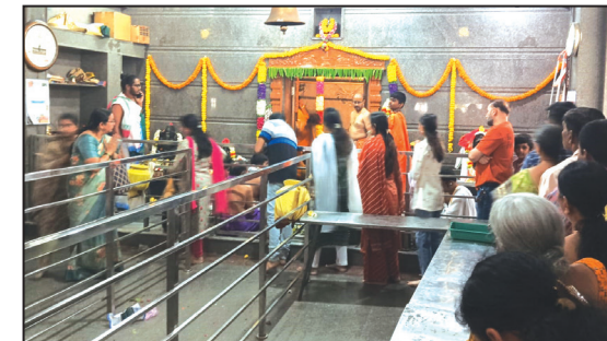
ಪೋಲೀಸ್ ಸಿಬ್ಬಂದಿಗಳು ಸೂಕ್ತ ವ್ಯವಸ್ಥೆ ಕಲ್ಪಿಸಿದ್ದರು. ಆಗಮಿಸಿದ ಎಲ್ಲ ಭಕ್ತರಿಗೂ ತೀರ್ಥ ಪ್ರಸಾದ ವಿತರಿಸಲಾಯಿತು.

ವಿವಿಧ ಪೂಜೆಗಳು ವಿಜೃಂಭಣೆಯಿಂದ ನೆರವೇರಿದವು. ಬೆಳಿಗ್ಗೆ ವಿಶೇಷ ಪೂಜೆ, ಅಭಿಷೇಕ, ಅರ್ಚನೆ, ಮಹಾಹಂಗಳಾರತಿ, ಸೇರಿದಂತೆ ವಿವಿಧ ಪೂಜೆಗಳು ನಡೆದವು. ನಗರ ಸೇರಿದಂತೆ ನಾನಾ ಕಡೆಯಿಂದ ಆಗಮಿಸಿದ ನೂರಾರು ಭಕ್ತರು ಸರದಿಯಲ್ಲಿ ನಿಂತು ಶಿವನ ದರ್ಶನ ಪಡೆದು, ವಿಶೇಷ ಪೂಜೆ, ಅರ್ಚನೆ ಸಲ್ಲಿಸಿ ಭಕ್ತಿ ಸಮರ್ಪಿಸಿದರು. ಭಕ್ತರ ಸಂಖ್ಯೆ ಹೆಚ್ಚಾದ ಹಿನ್ನೆಲೆ