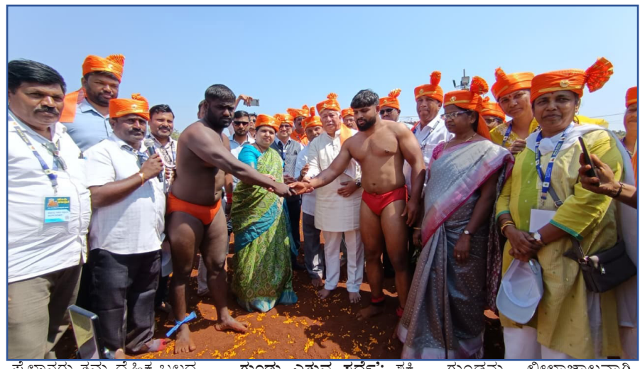
ಪೈಲ್ವಾನರು ತಮ್ಮ ದೈಹಿಕ ಬಲದ ಜೊತೆಗೆ ಮಾನಸಿಕ ತಂತ್ರಗಾರಿಕೆಯನ್ನು ಪ್ರದರ್ಶಿಸಿದರು. ಮೈದಾನದ ಸುತ್ತಲೂ ಕಿಕ್ಕಿರಿದು ತುಂಬಿದ್ದ ಪ್ರೇಕ್ಷಕರು ಪ್ರತಿ ಪಟ್ಟುಗಳಿಗೂ ಚಪ್ಪಾಳೆ ತಟ್ಟಿ ಪೈಲ್ವಾನರನ್ನು ಪ್ರೋತ್ಸಾಹಿಸಿದರು. ಉಸಿರು ಬಿಗಿಹಿಡಿಯುವಂತೆ ಮಾಡಿದ

ಮಲ್ಲಮ್ಮ ನುಡಿ ವಾರ್ತೆ ವಿಜಯನಗರ ಐತಿಹಾಸಿಕ ವಿಜಯನಗರ ಸಾಮ್ರಾಜ್ಯದ ಗತವ್ಯಭವನನುಸುವಂತೆ, ಹಂಪಿಯ ಹೊಸಮಲಪನಗರಿಯ ವಿದ್ಯಾರಣ್ಯ ಪೀಠದ ಮೈದಾನದಲ್ಲಿ ಶನಿವಾರ ಸಾಂಪ್ರದಾಯಿಕ ಮಣ್ಣಿನ ಕುಸ್ತಿ ಪಂದ್ಯಾವಳಿ ಪ್ರೇಕ್ಷಕರ ಮನವೀರಿಸಿತು. ಸುತ್ತಲೂ ಹೂವುಗಳಿಂದ ಅಲಂಕೃತಗೊಂಡಿದ್ದ ಕೆಂಪು ಮಣ್ಣಿನ ಅಖಾಡವು ಪೈಲ್ವಾನರ ಸೇನಾಪತಿಗಳಿಗೆ ಸಾಕ್ಷಿಯಾಯಿತು. ಕೇಸರಿ ಮತ್ತು ಕೆಂಪು ಬಣ್ಣದ ಲಂಗೋಟ ಧರಿಸಿ ಅಖಾಡಕ್ಕೆ ಓಡಿ ಪೈಲ್ವಾನರ, ಮಣ್ಣನ್ನು ಮೈಗೆ ಹಚ್ಚಿಕೊಂಡು ಪರಸ್ಪರ ಸವಾಲು ಹಾಕಿದರು. ಮಣ್ಣಿನಲ್ಲಿ ಉರುಳಾಡುತ್ತಾ, ಒಬ್ಬರನ್ನೊಬ್ಬರು ಕೆಡವಲು ನಡೆಸಿದ ಕಸರತ್ತು ನೆರೆದಿದ್ದ ಸಹಸ್ರಾರು ತೀರಾಭಿಮಾನಿಗಳನ್ನು ಹುಚ್ಚೆದ್ದು ಕುಣಿಯುವಂತೆ ಮಾಡಿತು. ಅಖಾಡದಲ್ಲಿ ರೆಫರಿಗಳ ತೀಕ್ಷ್ಣ ನೋಟದ ನಡುವೆ ನಡೆದ ಪಂದ್ಯದಲ್ಲಿ