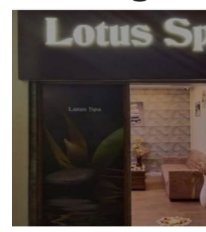
ಮಲ್ಲಮ್ಮ ನುಡಿ ವಾರ್ತೆ ಬೀದರ್: ಲೋಟಸ್ ಸ್ಪಾ ಹೆಸರಿನಲ್ಲಿ ವೇಶ್ಯವಾಣಿ ದಂಧ ನಡೆಸುತ್ತಿದ್ದ ಅಡ್ಡಿಯ ಮೇಲೆ ದಾಳಿ ಮಾಡಿದ ಜಿಲ್ಲಾ ಪೊಲೀಸರು ವಿವಿಧ ರಾಜ್ಯದ ಐವರು ಯುವತಿಯನ್ನು ರಕ್ಷಣೆ