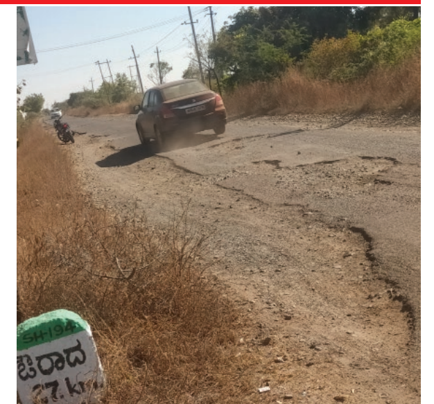
ಸಂಚರಿಸುತ್ತವೆ. ಅದರಲ್ಲಿ ಬೈಕ್ ಸವಾರ ಗುಂಡಿಯಲ್ಲಿ ಬಿದ್ದು ಕೈ ಕಾಲು ಪೆಟ್ಟಾಗಿರುವ (2ನೇ ಪುಟ ನೋಡಿ)

ಮಲ್ಲಮ್ ನುಡಿ ವಾರ್ತೆ (ಪರಮೇಶ ರಾಂಪುರೆ) ಕಮಲನಗರ:ಜಿ.4:ಕಮಲನಗರ ನಿಂದ ರಾಂಪುರೆ ಗ್ರಾಮಕ್ಕೆ ಹೋಗುವ ರಸ್ತೆ ಮಧ್ಯದಲ್ಲಿ ಗುಂಡಿ ಸಂಖ್ಯೆ ದಿನದಿನಕ್ಕೆ ಹೆಚ್ಚಾಗುತ್ತಿವೆ ಇದರಿಂದ ವಾಹನ ಸವಾರರು ತಮ್ಮ ಜೀವ ಕೈಯಲ್ಲಿ ಇಟ್ಟುಕೊಂಡು ಹೋಗುವ ಸ್ಥಿತಿ ನಿರ್ಮಾಣವಾಗಿದೆ. ಕಮಲನಗರ ನಿಂದ ತಾಲೂಕು ಕೇಂದ್ರ ಪಿರಾದಗೆ ಹೋಗುವ ಮೂಲ ರಸ್ತೆ ಇದಾಗಿದ್ದು ದಿನಾಲೂ ಸಾವಿರಾರು ವಾಹನಗಳು