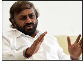
ಶಿಕ್ಷಣ ಇಲಾಖೆಗೆ ಮೈಕ್ರೋ ಯೋಜನೆಯಡಿ 2023 ರಲ್ಲಿ 37 ಕಾಮಗಾರಿಗಳಿಗೆ 4.65 ಕೋಟಿ ರೂ. ನೀಡಲಾಗಿದ್ದು ಪೂರ್ಣಗೊಳಿಸುವಂತೆ ಸಚಿವರು ಸೂಚಿಸಿದರು.